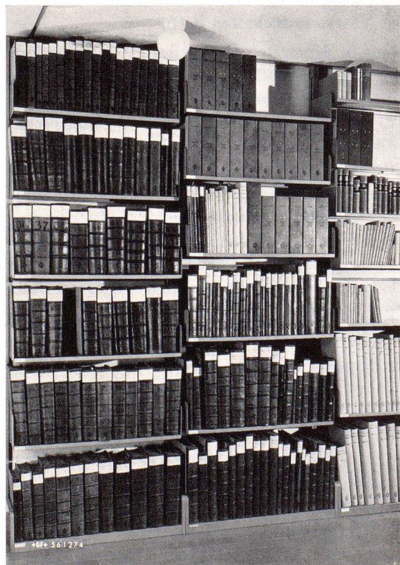
Standort des Haffterarchivs in der Eisen-Bibliothek

Die wirtschaftsgeschichtliche Forschung ist sich darüber längst im klaren, dass Firmenarchive zu ihren wichtigsten Quellen gehören. Quellen haben ihre Schicksale, und keine Quellengattung ist gefährdeter als gerade die Firmenarchive. Die blühende Entwicklung eines Unternehmens erstickt oft das Interesse am geschichtlichen Werden, oder aber die Blüte bleibt aus, und in diesem Falle sind die Zeugen des Versagens geradezu un-