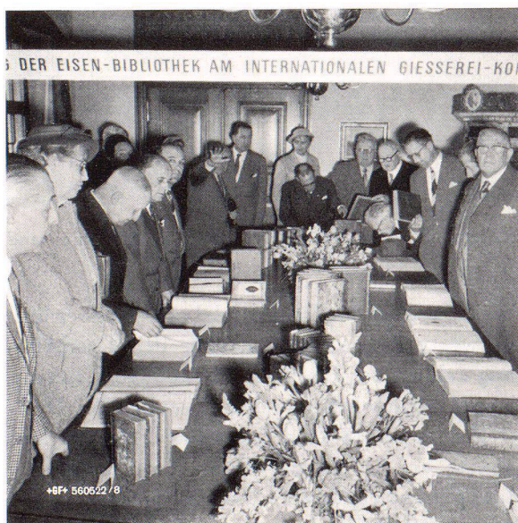
Besichtigung der Bücherausstellung im Sitzungszimmer der Eisen-Bibliothek