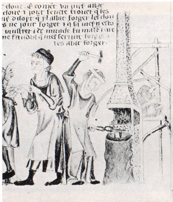
Schubert Taf. XIV. Schmiedeszene aus der Holkham Bibel (1325—1330). Der Schmied, der den Auftrag hatte, die Nägel zum Kreuze Christi zu schmieden, weigerte sich und überliess die Arbeit seiner Frau (Schubert S. 143). Der Begleittext der Miniatur ist in normannisch-französischer Sprache abgefasst.

gen. Schubert geht auf jede einzelne Epoche der englischen Geschichte ein, zeigt die Rolle auf, die Eisenproduktion und Verarbeitung spielten. Die im Domesday Book, der einzigartigen Quelle zur Geschichte der englischen Wirtschaft im 11. Jahrhundert, aufgezählten Eisenvorkommen und Schmieden, samt den Wäldern, von denen jede Eisenverhüttung abhängig war, werden vom Verfasser kartographisch erfasst. Das Domesday Book enthält auch die erste Erwähnung über die Anwendung der Wasserkraft im Eisenhammerwerk.