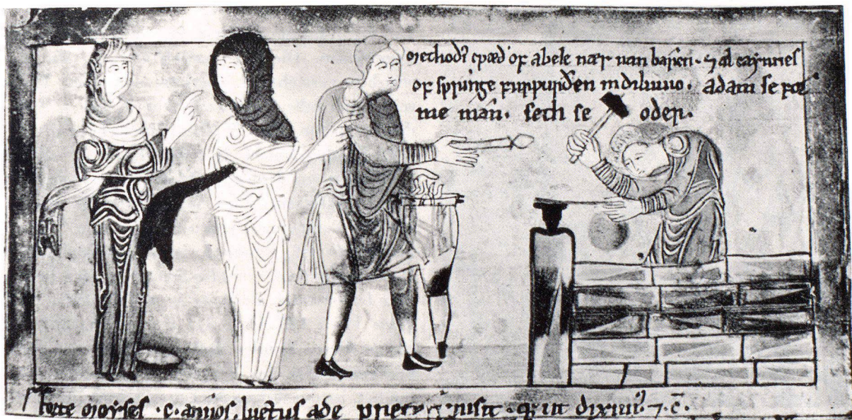
Schubert Taf. VII. Angelsächsische Schmiede (Miniatur aus einer Handschrift des 11. Jahrhunderts im Britischen Museum)

Zur Zeit, als der führende deutsche Historiker Leopold von Ranke (1795—1886) seine Weltgeschichte zu schreiben begann, bereitete sich Ludwig Beck (1841—1918) darauf vor, «Die Geschichte des Eisens in technischer und kulturgeschichtlicher Beziehung» als Weltgeschichte des Eisens zu verfassen. Der Tod nahm Ranke 1886 die Feder aus der Hand, nachdem es ihm gelungen war, sechs Bände seines geplanten Werkes zu veröffentlichen und bis ins 10. nachchristliche Jahrhundert vorzustossen. Ludwig Beck war es vergönnt, seine Geschichte des Eisens abzuschliessen; in fünf Bänden mit über 6000 Seiten schilderte er die Geschichte des Eisens bei allen Völkern von der Urzeit bis in seine Gegenwart. Die Gesamtschau, die Ranke und Beck für ihre Themen erstrebten, ist in ihrer Parallelität nicht zufällig; sie entsprach dem geistigen We-