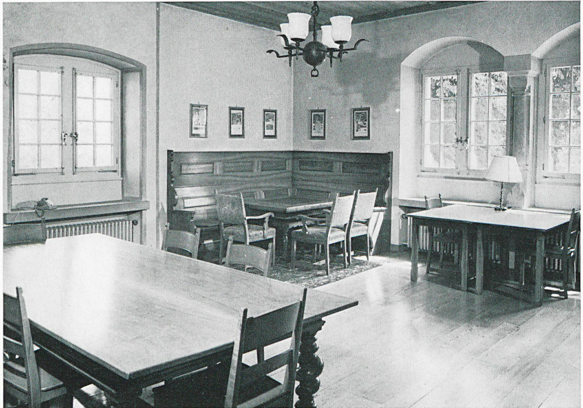
Leseräume mit sprichwörtlich gutem Arbeitsklima

Nach internationalen Normen erstellte Kataloge – Autorenkatalog und Sachkatalog mit Schlagwortsystem