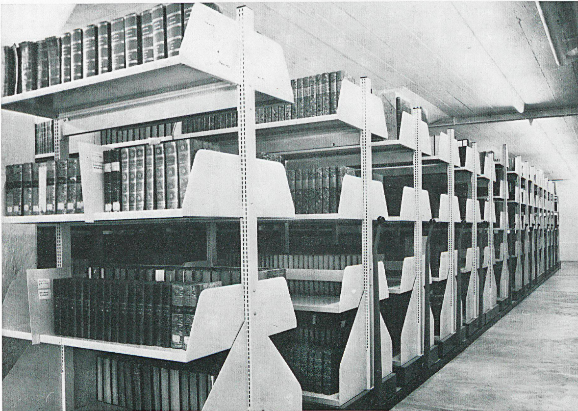
Moderne Compact-Anlage in den Büchermagazinen