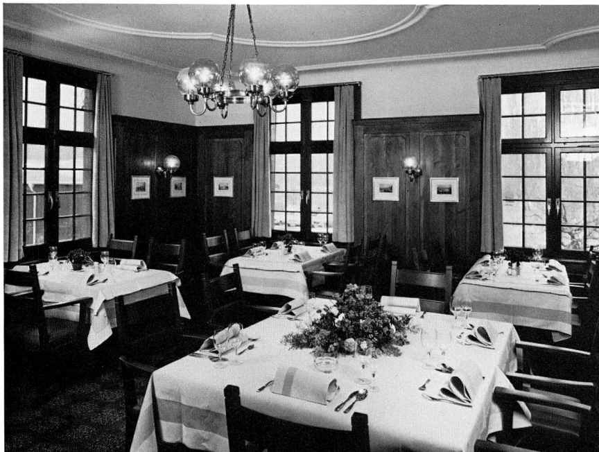
Das «Johann-Conrad-Fischer-Zimmer» verbreitet mit seinem schönen Holztäfer und der restaurierten Stukkaturdecke eine besonders gemütliche Atmosphäre.

Zwei gemütliche Gaststuben bieten den Gästen im ersten Stock eine behagliche Atmosphäre und eine einmalig schöne Aussicht auf den Rhein.