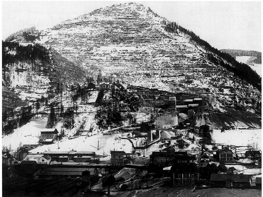
Abb. 2: Der Steirischer Erzberg um 1925. Im Vordergrund: Aufbereitungs- und Röstanlagen.