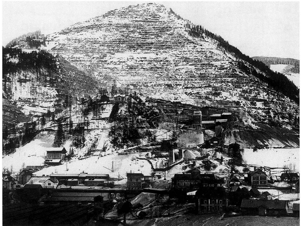
Abb. 2: Der Steirischer Erzberg um 1925. Im Vordergrund: Aufbereitungs- und Röstanlagen.

geschichte» im eigentlichen Sinne – beschreibt prägnant, klar und übersichtlich Entstehung und Entwicklung der «Innernberger», ohne in eher belanglose Details abzugleiten, wie dies z. B. bei A. Pantz 2 stellenweise der Fall ist. Die Kapitel 2, 3 und 4 gelten seit langem als unentbehrliche Hilfe bei der Erforschung der alpenländischen Bergbau- und Eisenhüttentechnik; namentlich «Der Hammerbetrieb» bringt interessante, von einem Fachmann beschriebene Einzelheiten des Frischens bzw. der Frischherdtechnologie und der Stahlbehandlung – Stichwort «Gärbstahl» 3 die letztlich auch Strategie und (Miss-)Erfolg des Unternehmens unmittelbar beeinflussten. Überraschenderweise hat Ferro seine Darstellung der staatlichen Innernberger Hauptgewerkschaft im Jahrbuch der Montan-Lehranstalt zu Vordernberg, der Keimzelle der heutigen Montanuniversität Leoben, veröffentlicht; die Vordernberger Lehranstalt gehörte bis 1848 den steirischen Ständen und war somit de facto eine durch die Stände finanzierte Privatschule, die von entsprechend qualifizierten Studenten ohne Gebühren oder Schulgeld besucht werden konnte.