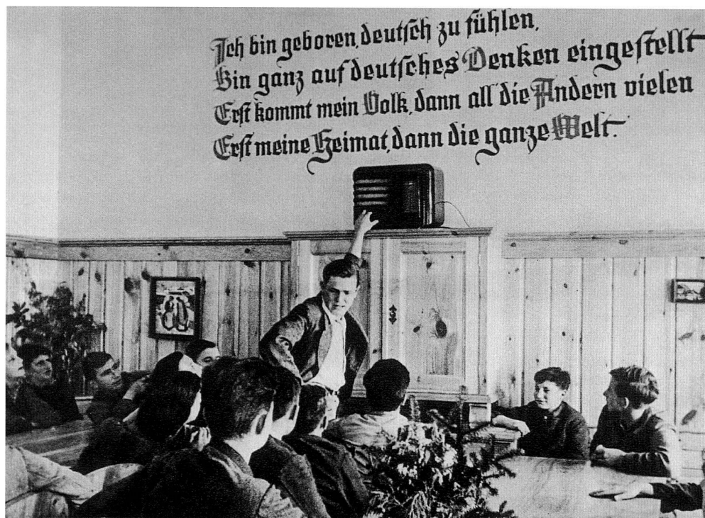
Abb. 4: Aufenthaltsraum für Lehrlinge der Firma Böhler in Kapfenberg (Steiermark), um 1939/49. (Vgl. Otto Böhler: Geschichte...Anm. 7).

verfasst worden und erschienen: Sozialdemokraten und Christlichsoziale standen einander feindlich gegenüber, die Arbeitslosigkeit nahm bedrohliche Ausmaße an und Banken brachen zusammen; nicht wenige Österreicher sahen im Nationalsozialismus zumindest einen Hoffnungsschimmer. In der ÖMAG musste die christlichsoziale Konzernführung mit einer nicht immer gut behandelten sozialdemokratischen Arbeiterschaft auskommen, und auf beiden Seiten gab es Scharfmacher. Unter diesen Umständen würde eine starke politische Färbung der Festschrift keineswegs überraschen, aber mit Ausnahme des Beitrages «Sozialpolitische Entwicklung», bei dem ohnehin keine Objektivität zu erwarten war (Reizwort: arbeitsfreier 1. Mai mit normaler Lohnzahlung), blieben alle anderen Kapitel weitgehendst frei von politischer oder gar gehässiger Diktion.