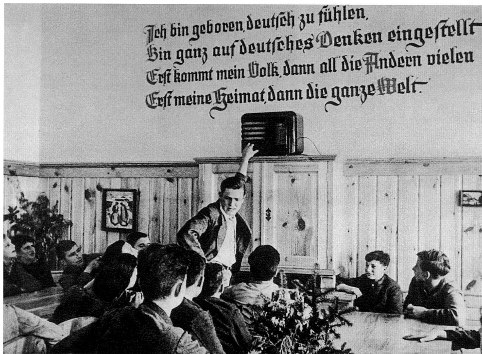
Abb. 4: Aufenthaltsraum für Lehrlinge der Firma Böhler in Kapfenberg (Steiermark), um 1939/49. (Vgl. Otto Böhler: Geschichte...Anm. 7).

verfasst worden und erschienen: Sozialdemokraten und Christlichsoziale standen einander feindlich gegenüber, die Arbeitslosigkeit nahm bedrohliche Ausmaße an und Banken brachen zusammen; nicht wenige Österreicher sahen im Nationalsozialismus zumindest einen Hoffnungsschimmer. In der ÖMAG musste die christlichsoziale Konzernführung mit einer nicht immer gut behandelten sozialdemokratischen Arbeiterschaft auskommen, und auf beiden Seiten gab es Scharfmacher. Unter diesen Umständen würde eine starke politische Färbung der Festschrift keineswegs überraschen, aber mit Ausnahme des Beitrages «Sozialpolitische Entwicklung», bei dem ohnehin keine Objektivität zu erwarten war (Reizwort: arbeitsfreier 1. Mai mit normaler Lohnzahlung), blieben alle anderen Kapitel weitgehendst frei von politischer oder gar gehässiger Diktion.