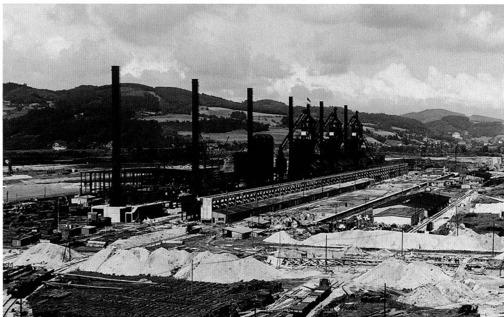
Abb. 5: Hochofenanlage der «Reichswerke» in Linz während des Baues, 18. Juni 1940. Die Hochofen 1, 2 und 3 (rechts) sind weitgehend fertiggestellt, für Ofen 4 stehen die Cowper-Winderhitzer und der Abgaskamin, für Ofen 5 und 6 nur die Abgaskamine. (Beginn der Roheisenerzeugung am 15. Oktober 1941 mit Ofen 1).