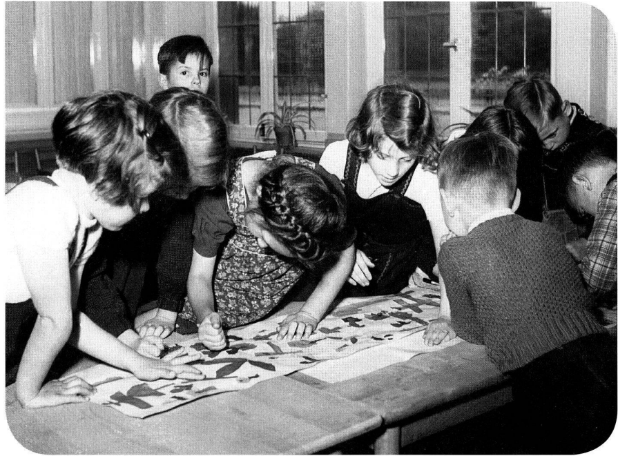
Basteln im werkseigenen Kindergarten, 1950er-Jahre.

Geb. am 17.4.1961, Privatdozent an der Ruhr-Universität Bochum, zurzeit Vertreter des Lehrstuhls für «Neuere und neueste Geschichte und Didaktik der Geschichte» an der Universität Dortmund und Lehrbeauftragter für Wirtschaftsgeschichte an der WHU Koblenz, Vorsitzender des «Arbeitskreis für kritische Unternehmens- und Industriegeschichte e. V.», Forschungsschwerpunkte: Sozial-, Wirtschafts-, Technik- und Unternehmensgeschichte.