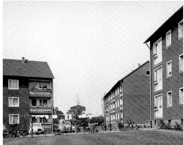
Hoesch Siedlung Westfalenburg in Dortmund-Eving, 1960er-Jahre.

Das umfassende Aufgabengebiet des Arbeitsdirektors wird am Beispiel des Films «Im Mittelpunkt steht der Mensch» deutlich, der im Jahr 1957 im Auftrag der Hoesch AG die Aufgabenfelder und das Selbstverständnis des Arbeitsdirektors zeigte. Diese reichten bei Hoesch von der Unfallverhütung über den Werkschutz, die Sozialwerkstätten, medizinische Betreuung, die Nähstube, die Grossküche, Kinderbetreuung, Ausbildungswerkstätten, die Werksbücherei, den Bau von Werksiedlungen und den Werksport bis