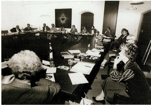
Bild 4: Erste Arbeitstagung zur Technikgeschichte 1978.