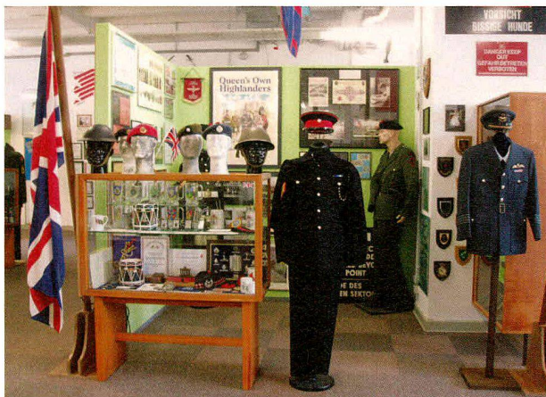
Die «Engländer-Ecke», die den ehemaligen Zivilangestellten der britischen Streitkräfte gewidmet ist.

Doch auch die immer wieder als Erklärung für das «Zeitphänomen Musealisierung» 29 herangezogene Kompensationstheorie von Hermann Lübke bietet einen Erklärungsansatz: