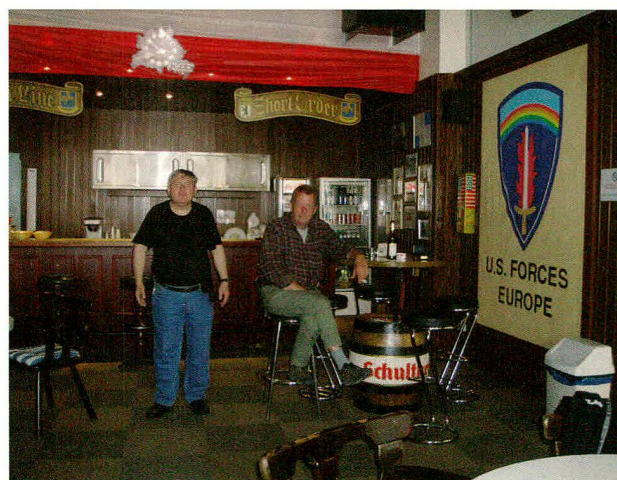
Zwei Vereinsmitglieder im Clubraum.