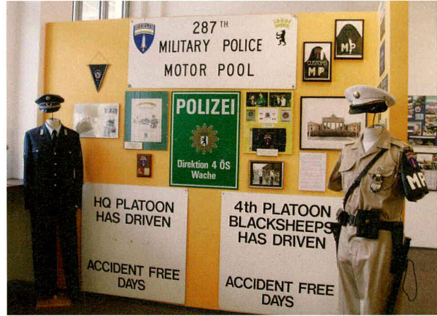
Blick auf die Ausstellungseinheit, die dem zivilen Wachschutz gewidmet ist.