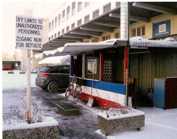
Der Zugang zum Museum auf dem Gelände der ehemaligen McNair-Barracks.