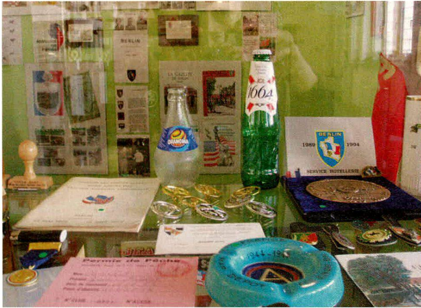
Eine Vitrine mit Souvenirs der französischen Zivilangestellten.