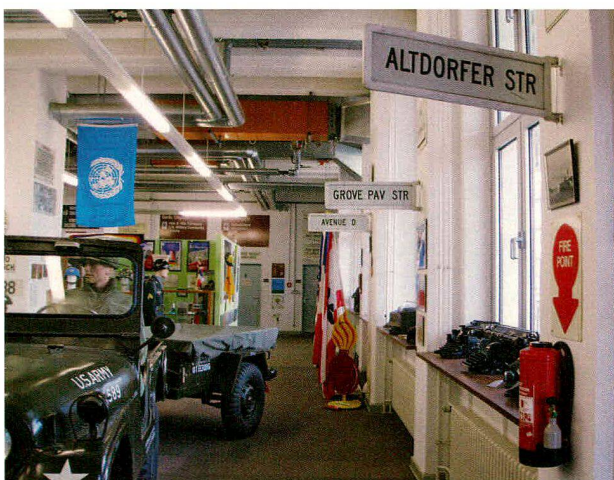
Die Objektordnung folgt einem lebensweltlichen Zusammenhang: In der «Maintenance Division» wurde alles von der Schreibmaschine bis zum Panzer repariert.

Ich habe das McNair-Museum etwa fünf Jahr lang begleitet und zwei Umzüge miterlebt. Die gesamte, sehr umfangreiche Sammlung wurde jeweils komplett eingepackt und am neuen Standort wieder in detail- und materialreichen Inszenierungen ausgestellt. Dieses Festhalten an den Objekten verwunderte mich, war mir doch bei meinen Besuchen aufgefallen, dass sich die anwesenden Vereinsmitglieder kaum in der Ausstellung aufhielten. Bei den meisten meiner Besuche war die Ausstellung leer. Gut besucht war hingegen der sogenannte «Clubraum», ein geselliger Zusammenkünfte vorbehaltener Raum, der von Umzug zu Umzug immer eigenständiger und grösser wurde: Bestand er anfänglich aus verstreut in der Ausstellung platzierten Tischen, so war er mit dem Umzug im Jahr 2009 zu einem eigenen, grossen Raum geworden, der mit mehreren Tischen und einer vollständigen Thekeneinrichtung bestückt war. Angesichts dieser Diskrepanz hinsichtlich der Raumaufteilung und der tatsächlichen Raumnutzung durch die Mitglieder fragte ich mich, warum sich die Museumsmacher die Mühe machten, bei jedem Umzug wieder sämtliche Objekte aufzubauen und ihnen sogar jedes Mal mehr Ausstellungsfläche einzuräumen, wenn sie doch im Vereinsalltag nur eine untergeordnete Rolle spiel-