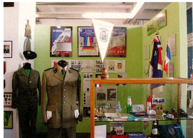
Blick in die «Franzosen-Ecke», in der Objekte aus der Lebenswelt der bei den französischen Streitkräften eingesetzten Zivilangestellten zusammengetragen sind.