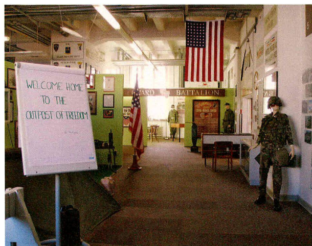
Eingangssituation des McNair-Museums.