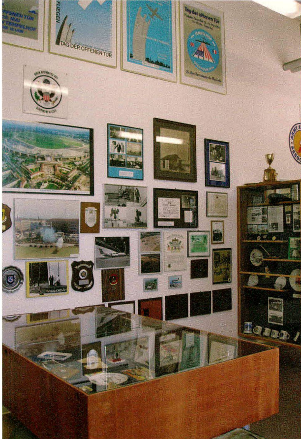
Blick in die «Tempelhof-Ecke» des Museums.

Eine Untersuchung des Amateurmuseums als kulturelle Äusserungsform