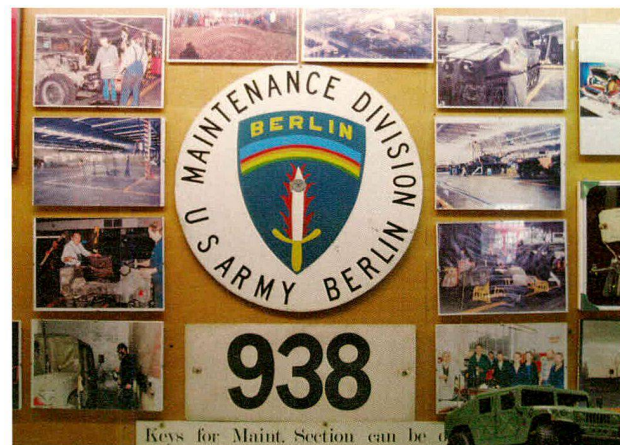
Eine Erinnerungstafel mit Objekten und Fotos aus der Maintenance Division.

schen Handlungsraum, der zur Befriedigung vielfältigster Bedürfnisse eingesetzt werden kann. Betrachtet man das Museum als kulturelle Äusserungsform oder soziale Praxis, öffnet man seinen Blick für die symbolische Dimension des Museummachens, so werden diese Bedürfnisse sichtbar und können als eine mögliche Ursache für die oft in der Zusammenarbeit zwischen Profis und Laien auftretenden Missverständnisse und Konflikte ausgemacht werden.