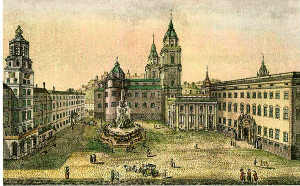
Der Salzburger Residenzbrunnen um 1810 nach einer kolorierten Radierung von Johann Michael Frey.