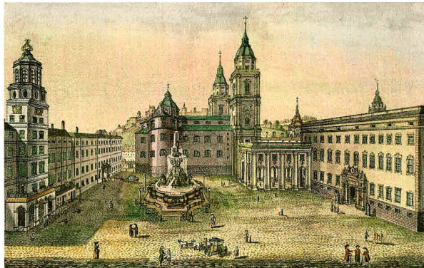
Der Salzburger Residenzbrunnen um 1810 nach einer kolorierten Radierung von Johann Michael Frey.

[Foto: Johann A. Boeck, Wahrhafte und anmutige Ansichten des alten Salzburg, Salzburg o.J., S. 75]