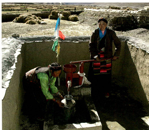
Dank der neuen Gemeinschaftswasserpumpe in Lhato gehören die kilometerweiten Fussmärsche zur nächsten Wasserstelle der Vergangenheit an.