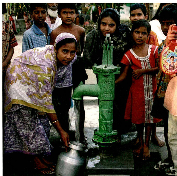
Indien (2007); Projektpartner: Mass Education (Indien).

Für alle drei Bilder: Vor allem die Frauen profitieren vom besseren Zugang zu Wasser, denn sie sind für die Versorgung der Familie mit Wasser verantwortlich.