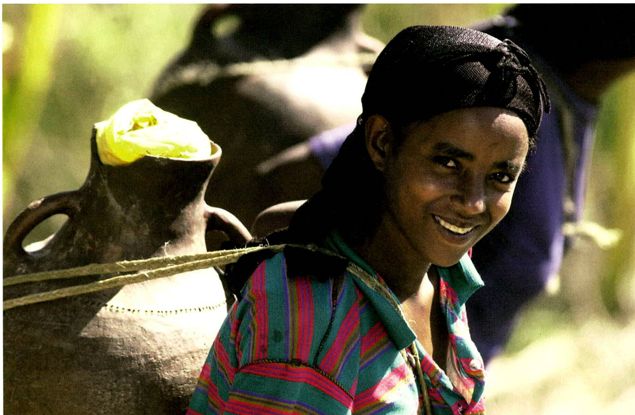
Äthiopien (2003); Projektpartner: Menschen für Menschen.