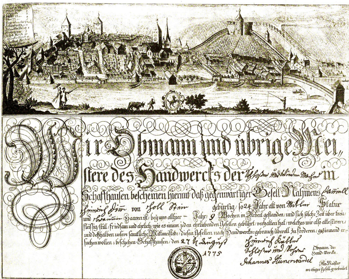
Kundschaft eines Schlossergesellen aus Schaffhausen 1775.

(Quelle: Klaus Stopp: Handwerkskundschaften der Schweiz. Arbeitsattestate wandernder Gesellen. Weissenhorn 1979, S. 41)