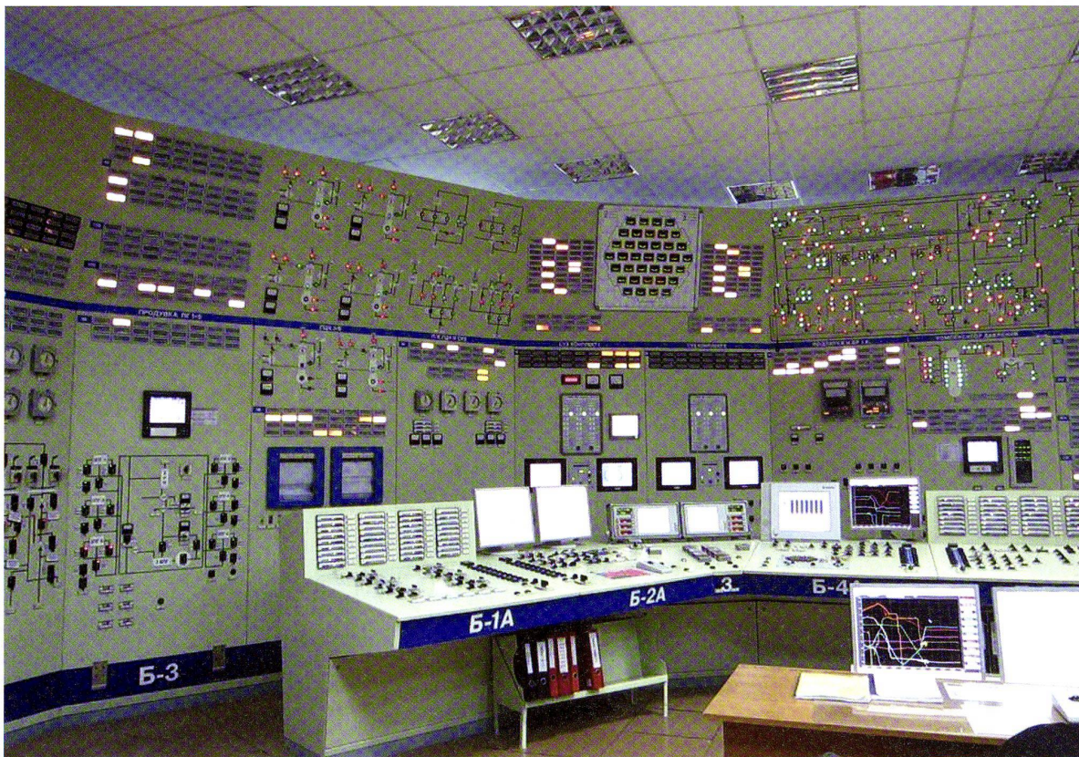
Wissensordnung an der Mensch-Maschine-Schnittstelle, 2013: KKW Rivne, Simulator Schaltwarte Block 2, VVER-440, Reaktorfahrpult und dazugehörige Anzeigetafeln. Die Ausrüstung des Simulators ist identisch mit jener der Original-Schaltwarte. Gut erkennbar sind oben links und rechts die aus der analogen Zeit beibehaltenen Fliessbilder des Primärkreislaufs und seiner Hilfssysteme. Im zentralen Bereich haben die digitalen Ausgabemedien des Reaktorschutzsystems die analoge Instrumentierung abgelöst. Die Kernquerschnittstafel im Zentrum oben zeigt auf einen Blick die sektoralen Positionen der (in den Anzeigefenstern farbig unterschiedlich umrahmten) Steuerstabgruppen, die hier sämtlich bis auf die unterste Position eingefahren sind: Der «Reaktor» wurde im Zuge einer Störfallsimulation schnellabgeschaltet. Dieses sogenannte mnemotablo wurde erst im Zuge einer Modernisierung eingerichtet: In der Originalausstattung der Warte von 1980 gaben analoge Anzeigen der Drehmeldesysteme (russ. sel'siny, von engl. selsyns) Auskunft über die Position der Steuerelemente.