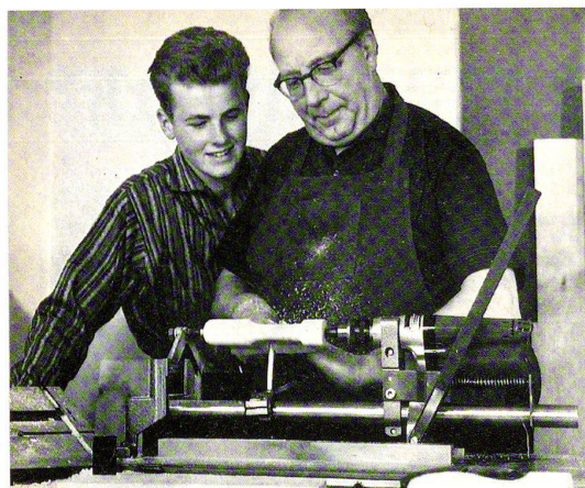
Bild 135 Längsdreheln an der Holzleibbank S 10. Anstelle des Universaltisches bildet der Quenhalter mit eingeschmübter Zentrierspitze den Gegenhalter.

«In Deutschland steht die Do-it-yourself-Bewegung noch ganz in ihren Anfängen», so Jochen Zschocke in der Einleitung zu seiner 1958 in Köln angenommenen wirtschaftswissenschaftlichen Dissertation. 7 Seine Nachforschungen in den USA jedoch liessen ihn zu der These gelangen, dass auch für die Bundesrepublik Deutschland von einem entstehenden Wachstumsmarkt in diesem Bereich auszugehen sei, der von vielerlei Akteuren bespielt werden könnte und sollte. 8 Dass Zschockes Prognosen sich bewahrheiten sollten, zeigten spätestens die Entwicklungen der späten 1960er-Jahre. Ausgehend von Pionierunternehmen wie Obi und Hornbach, kam es zu einem raschen Wachstum des Einzelhandels-typs Bau- und Heimwerkermarkt – eines Formats, das bis zu dieser Zeit in der Bundesrepublik noch gänzlich unbekannt war. 9 1983 vermeldete der «Spiegel», dass «[w]eder die flaue Konjunktur noch steigende Preise [...] die Bundesbürger davon ab[halten], immer mehr Geld aufzuwenden, um in ihrer Freizeit Haus und Hof zu verschönern [...]». 10 Heimwerken wurde zum Milliarden-