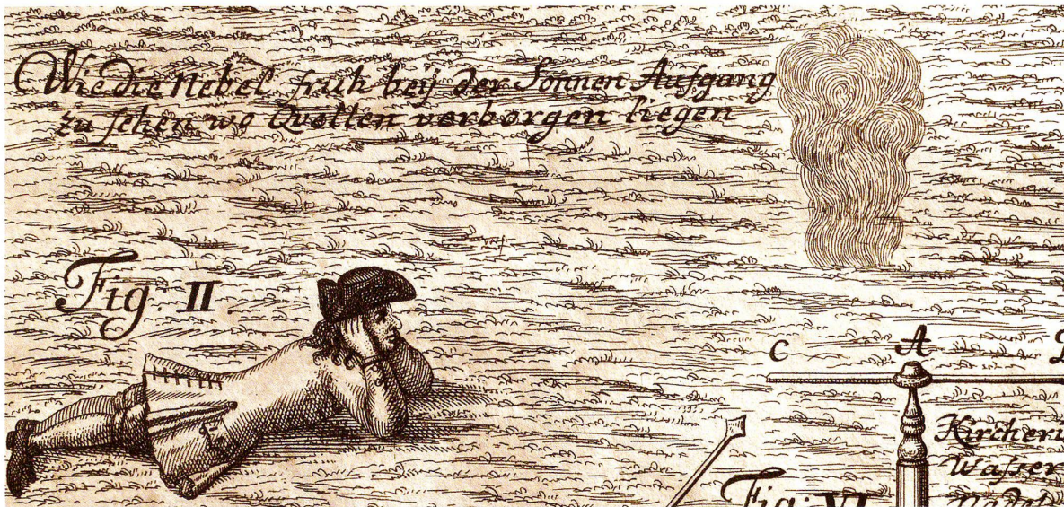
Auf der Lauer: Die Suche nach dem «Ursprung der Quellen und Brunnen».