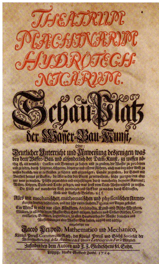
Titelblatt des «Theatrum Machinarum Hydrotechnicarum» von Jacob Leupold 1724.

Das «Theatrum» als technisches Werk wird im vorliegenden Aufsatz nach nichttechnischen Wissensbeständen befragt. Dies ist nur ein kleines Beispiel dafür, dass sich die technisch orientierten Bestände der Eisenbibliothek auch als Quelle für Fragestellungen nutzen lassen, die abseits der Technikgeschichte im engeren