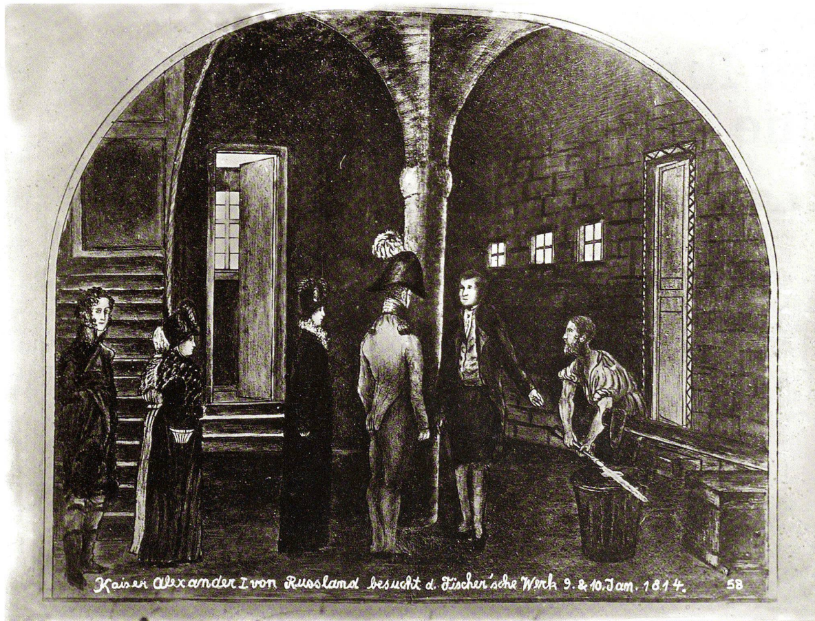
«Kaiser Alexander I von Russland besucht d. Fischer'sche Werk, 9. & 10. Januar 1814.»