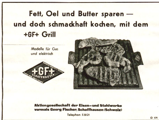
Im Zweiten Weltkrieg werden Speisefette rationiert: Zeitungsinsert von 1942.