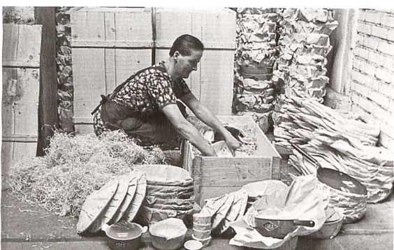
In einer Verkaufsbroschüre von 1940 wird der aufwendige Herstellungsprozess beschrieben und illustriert: Guss, Emaillierung und Verpackung von Kochtöpfen.