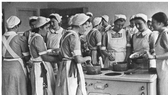
In der Hauswirtschaftsschule sind GF-Pfannen im Einsatz.

In allen Wirtschaftsbereichen wurde in dieser Zeit die Werbung in den Dienst einer nationalen Identitätsbildung gestellt. Als angesichts der aggressiven Aussenpolitik des nördlichen Nachbarn immer klarer wurde, dass die Nachkriegs- eine Zwischenkriegszeit sein würde, nahmen auch die Anstrengungen zu, eine leistungsfähige Kriegswirtschaft aufzubauen. Schliesslich belastete jeder unnötige Import die Aussenhandelsbilanz. Der Kontext der Geistigen Landesverteidigung 17 bot den geeigneten Rahmen für die Inszenierung nationaler Identität. 18 In diesem Sinne animierte auch das Korrespondenzblatt des Schweizerischen Vereins der Gewerbe- und Hauswirtschaftslehrerinnen im März 1935 seine Leserinnen dazu, im Unterricht für die GF-Produkte zu werben: