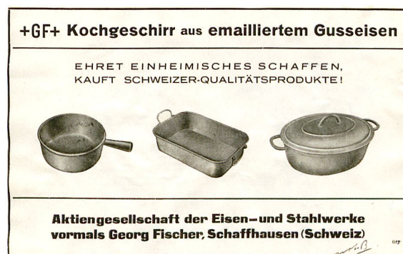
Nationale Identitätsbildung am Kochherd: Zeitungsinserat 1933.

sent, und ein Jahr später beteiligte er sich am ersten schweizerischen Ausstellungszug, der zwischen Juni und Oktober 1935 mit 16 ausrangierten SBB-Wagen als fahrende Ausstellung an allen grösseren Bahnhöfen der Schweiz haltmachte: «Der Besuch war überall sehr stark, denn die Schulen wurden zum Besuche aufgeboten», aber auch das Publikumsinteresse war hoch, trotz dem stattlichen Eintrittspreis von einem Franken pro Person. 14 Alle diese Bemühungen zeigten Wirkung, und bald waren die Bestellungen grösser als die Lagerbestände.