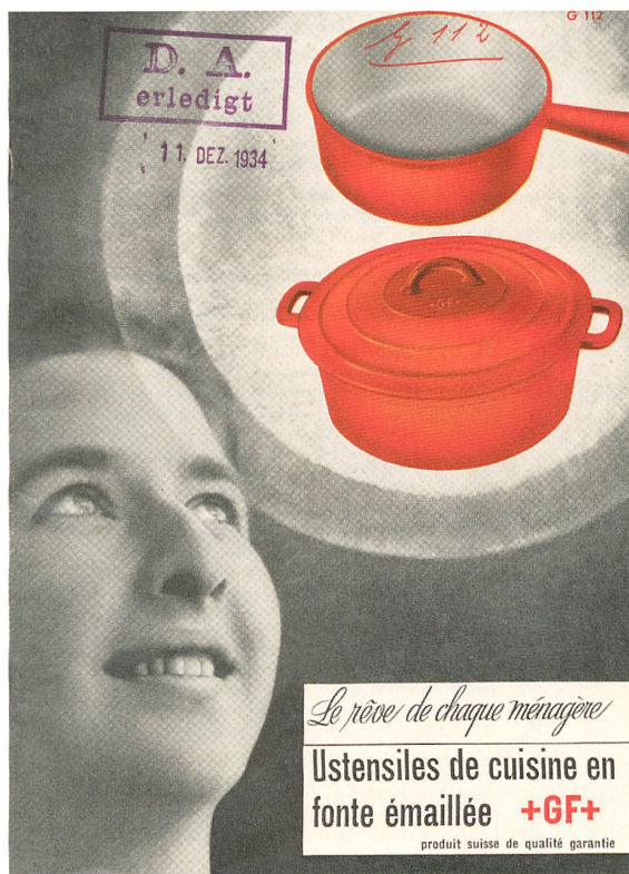
«Der Traum jeder Hausfrau»: Werbebroschüre von 1934.

Alfred Dietzi packte seinen Musterkoffer «mit einer Anzahl Kochgeschirren (ca. 16 kg)» 13 und bereiste damit die Schweiz. Auch an der Schweizer Mustermesse 1934 war er mit einem Sortiment aus inzwischen 13 Modellen für Gas- und Elektroherde in 36 Grössen prä-