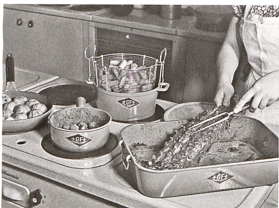
«Vom Herd direkt auf den Tisch»: Im gleichen Topf kochen und servieren.