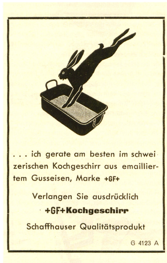
Werbecliché von 1934.

sent, und ein Jahr später beteiligte er sich am ersten schweizerischen Ausstellungszug, der zwischen Juni und Oktober 1935 mit 16 ausrangierten SBB-Wagen als fahrende Ausstellung an allen grösseren Bahnhöfen der Schweiz haltmachte: «Der Besuch war überall sehr stark, denn die Schulen wurden zum Besuche aufgeboten», aber auch das Publikumsinteresse war hoch, trotz dem stattlichen Eintrittspreis von einem Franken pro Person. 14 Alle diese Bemühungen zeigten Wirkung, und bald waren die Bestellungen grösser als die Lagerbestände.