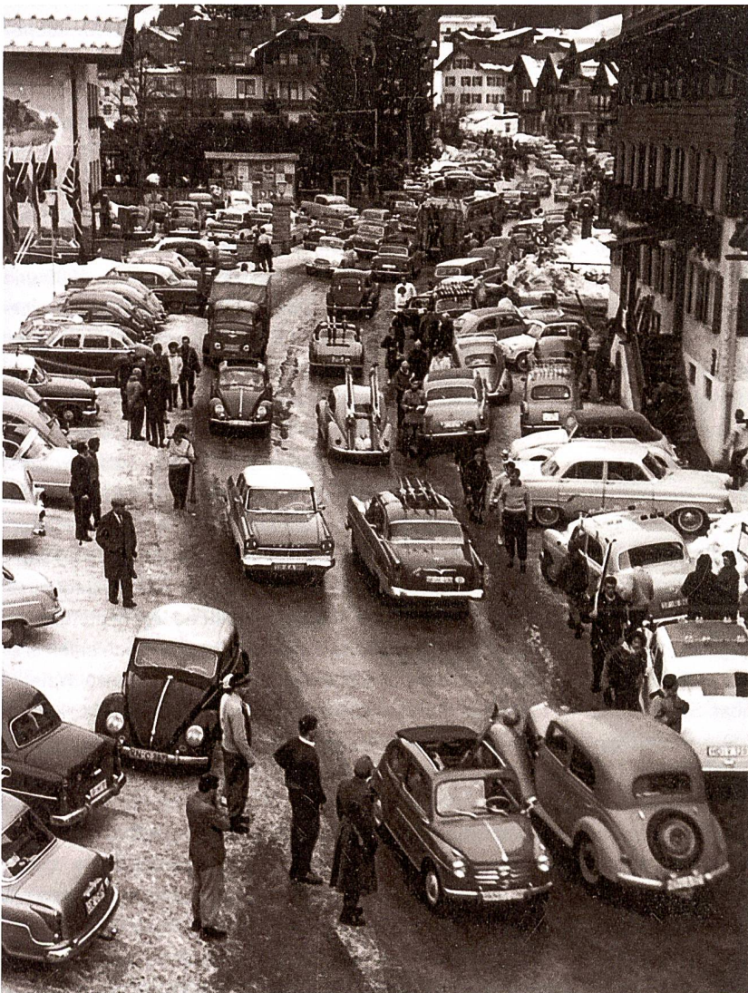
4 Autoverkehr in Riezern, Kleinwalsertal, Januar/Februar 1960.

Die Kehrseite dieses touristischen Erfolgs war die Blechlawine, die sich über die Walserstrasse ins Tal ergoss. Schon Ende der 1940er-Jahre liest man in der Talzeitung wiederholt über den zunehmenden Verkehr, überlastete und schadhafte Strassen als Gegenstände von Beschwerden und als Tagesordnungspunkte im Gemeinderat. Am ersten Märzsonntag des Jahres 1952 wurden neben 180 Fahrten des Postbus-Linienverkehrs 1000 Kraftfahrzeuge gezählt, die die Zufahrtsstrasse zum Tal passierten. 27 Ziemlich genau 30 Jahre später, am 21. Februar 1982, ebenfalls einem Sonntag, zählte man mit 3117 Kraftfahrzeugen rund dreimal so viele, 28 1992 sprach der Walser, Gemeindeblatt und Talzeitung, von täglich 4700 Autos. 29 Über den hausgemachten Verkehr informieren die Zulassungszahlen im Tal: Gab es hier 1932 acht PKW und 14 Motorräder, so waren es 1963 bereits 511 PKW, LKW und Busse sowie 91 Motorräder und 1992 2125 PKW, LKW und Busse sowie 164 einspurige Fahrzeuge (Mopeds und Motorräder). 30