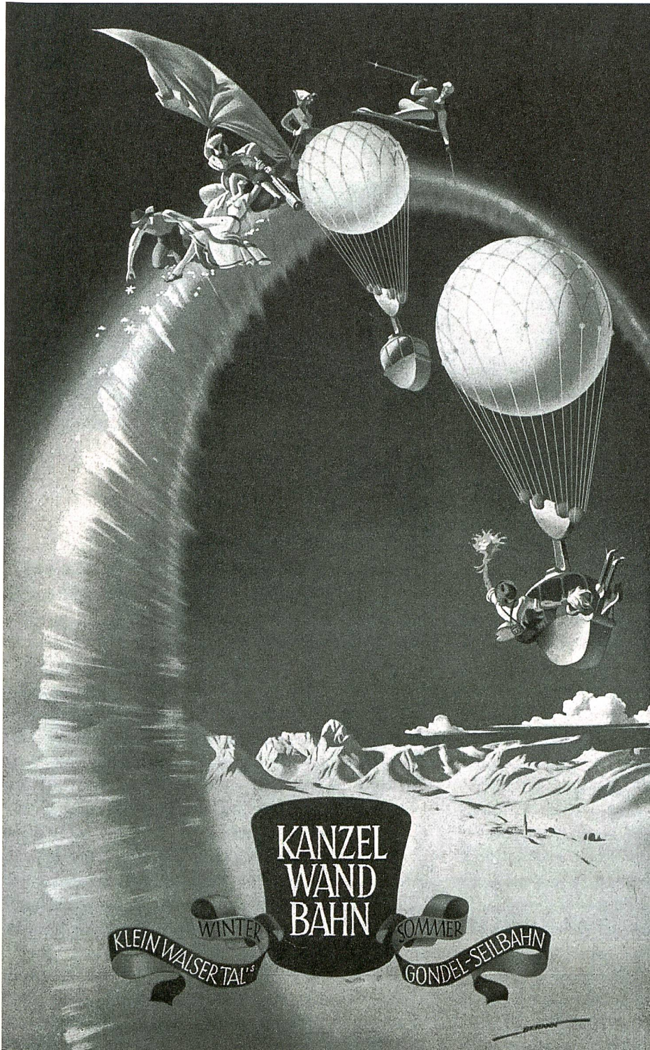
1 H. C. Berann: Werbung für die Kanzelwandbahn im Kleinwalsertal, 1955.

Im Jahr 1933 beförderte die Bahn 99 000 Passagiere. 1936 bereits 160 000. Der Erfolg hatte aber auch eine Kehrseite. Im Winter 1936/37 mussten an der Talstation Platzkarten ausgegeben werden, um die Warteschlangen zu verkürzen. Wartezeiten von bis zu zwei Stunden riefen – so der Bericht der Betreibergesellschaft – «sichtliche Verstimmung des Publikums» hervor. Die Gesellschaft berichtete auch über die chaotischen Verhältnisse an der Talstation: Autobusse, v. a. deren Ausstiegsverkehr, PKW, Pferdeschlitten, die Warteschlange der Skiläufer und der Fußgängerverkehr behinderten sich demnach gegenseitig. Handlungsbedarf