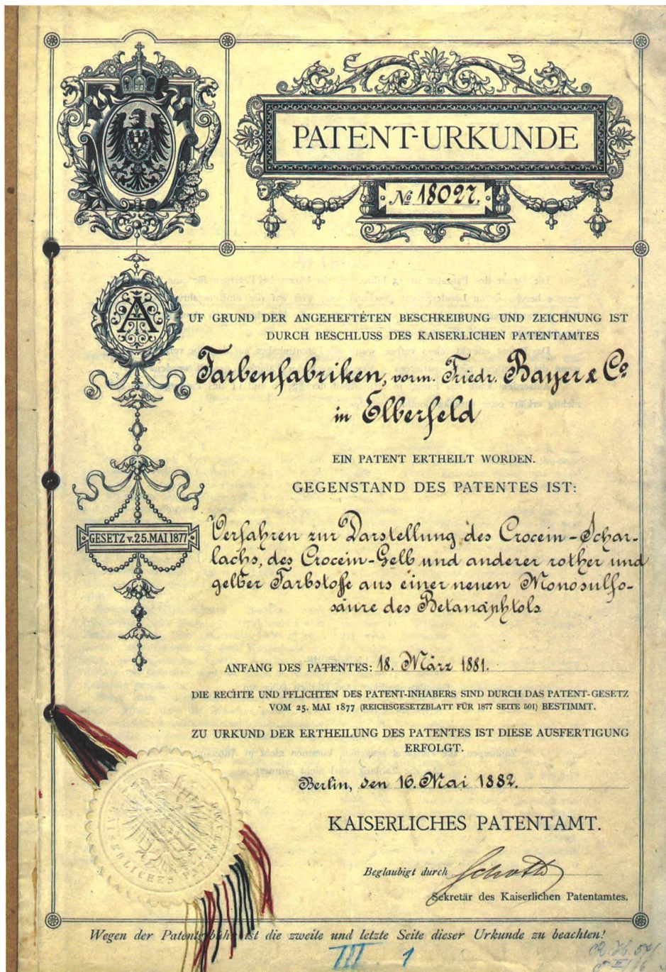
1 Das erste Zeugnis eigener Grundlagenforschung: Patenturkunde Croceinscharlach von 1882.

industrielle Umsetzung, da die Synthese grosse Mengen der sehr teuren Chemikalie Brom benötigte. Bei der technischen Überführung kam der BASF eine besondere Bedeutung zu, da es dem dort angestellten Chemiker Heinrich Caro gelang, den Farbstoff auf einem wirtschaftlichen Weg industriell herzustellen. 10 Wie im Falle der Anilinfarben fand die Zusammensetzung des synthetischen Alizarins den Weg an die Öffentlichkeit, weshalb Konkurrenzunternehmen – unter ihnen auch Bayer – die Produktion zu Beginn der 1870er-Jahre aufnahmen und teilweise effizienter produzierten als BASF selbst. Trotz dieser kurzfristigen wirtschaftlichen Unterlegenheit zog BASF langfristige strategische Vorteile aus der Synthese des Alizarins. Die Kooperation mit Hochschulen führte nicht nur zu einem Wissenstransfer zwischen den beiden Organisationen, sondern