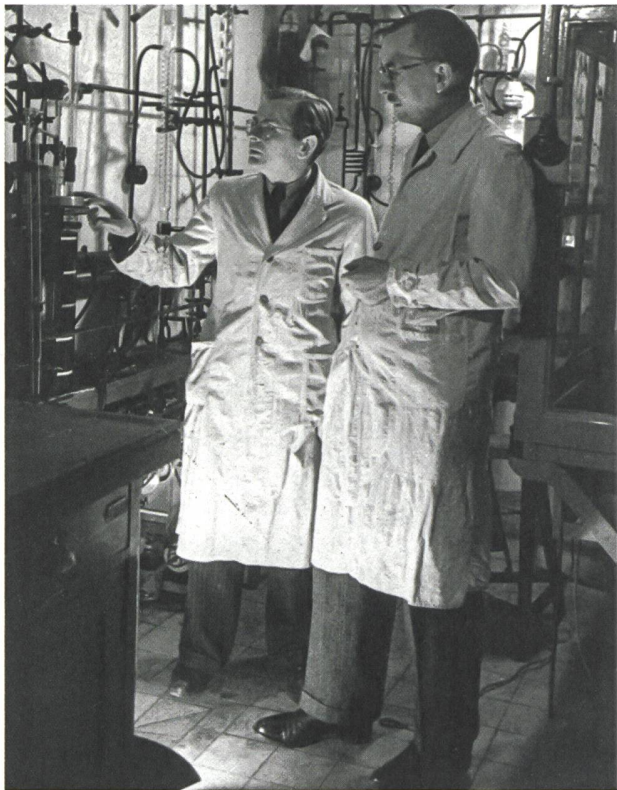
2 Karl Ziegler (r.) und Günther O. Schenck im Laboratorium des Hallenser Chemischen Instituts, um 1940.

Ohne besonderen Verwaltungsakt wurde aus dem kommissarischen Leiter in Mülheim ein Institutsdirektor, auch wenn sich Ziegler noch einmal – vergeblich – um ei-