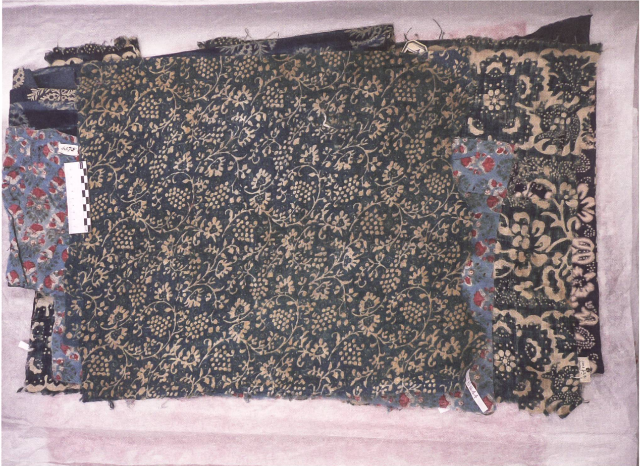
1 Bedruckte Baumwolle, schweizerisches Fabrikat, Mitte 18. Jahrhundert. 11 Fäden/cm. Reservedruck mit Modeln, Indigobad.

kein Dualismus zwischen gelehrter Chemie und angewandter Indiennage zugrunde, wohl aber ein Unterschied zwischen Wissen und Können. Das Beispiel des Basler Fabrikanten Johannes Ryhiner zeigt, dass es einerseits vielfältige Übergänge zwischen stillschweigendem und ausformuliertem, naturphilosophischem und technischem Wissen gab, die Kunst des Färbens aber andererseits nur durch praktisches Tun beherrschbar wurde. 4