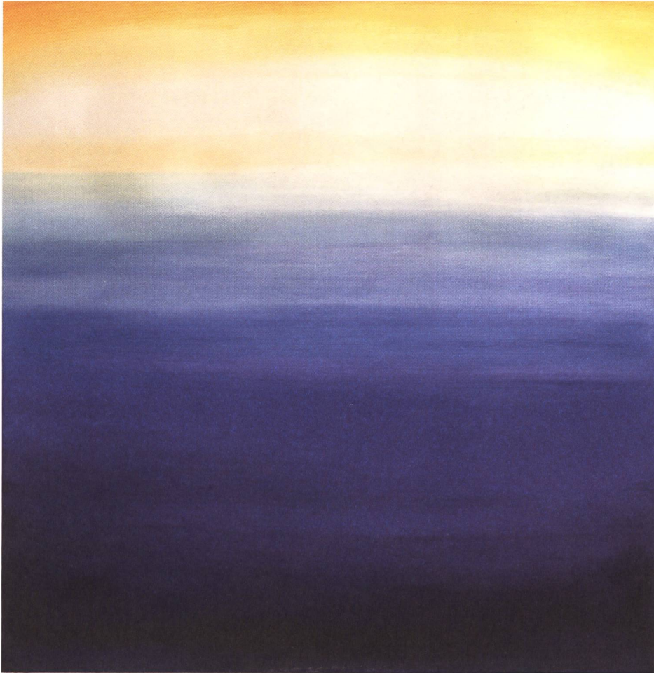
3 Come è profondo il mare. 1987, Acryl und Pigmente auf Pappelsperrholz, 90x90 cm.