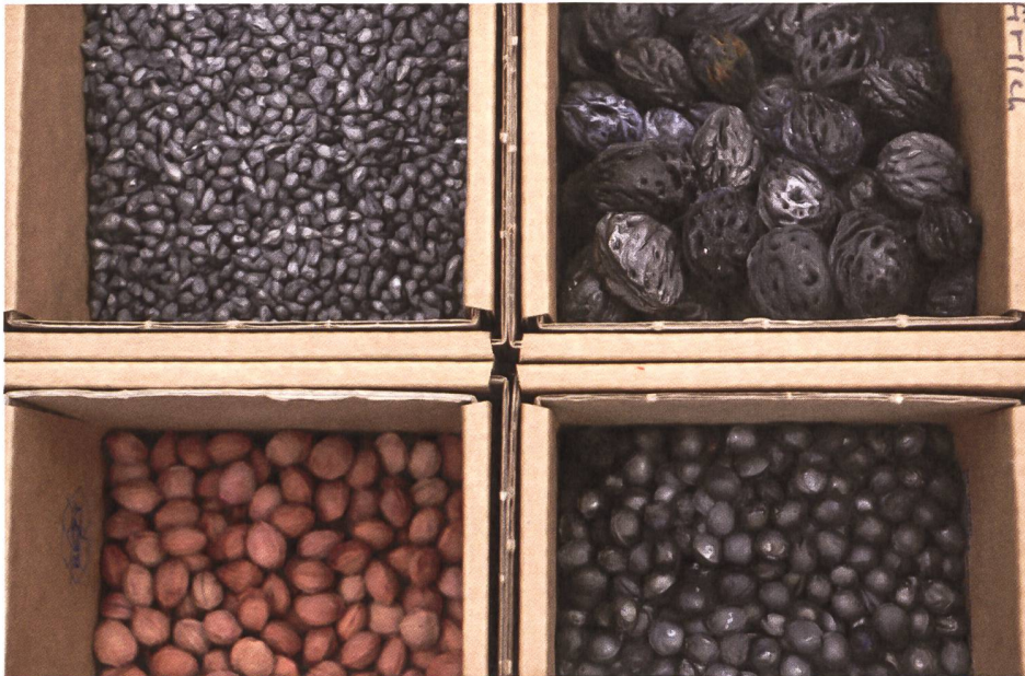
7 Fruchtkerne: Traubenkerne gebrannt, Pfirsichkerne gebrannt, Kirschkkerne roh und gebrannt.