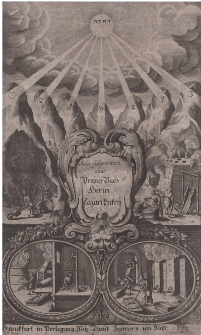
2 Frontispiz, Lazarus Ercker, Aula subterranea domina dominantium subdita subditorum, Frankfurt: P. Humm, 1673. Folioformat.

Die Hervorhebung von Saturn und des ihm zugeordneten schweren, leicht schmelz- und formbaren Metalls ist nicht ausschliesslich auf dessen Bedeutung im Saigerprozess