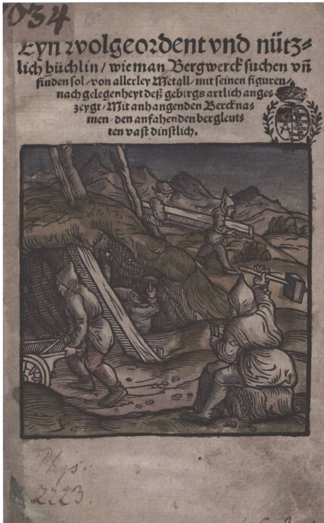
1 Titelblatt, Ulrich Rülein von Calw, Eyn wohlgeordnet und nützlich büchlein, wie man bergwerk suchen und finden soll, Worms: Peter Schöffer, 1518. Kolorierter Holzschnitt.

sich direkt mit der Titelkartusche und den beiden Vignetten der Metallverarbeitung im unteren Teil des Stichs.