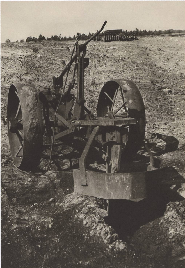
4 Der «Schällicke-Pflug» war ein Spezialgerät für die Kippenrekultivierung, 1963.

kultivierung und die Nutzung der Bergbaufolgelandschaften als Erholungsgebiete Hinweise. 31 Insofern wundert nicht, dass Forstwirte für die Lausitzer Rekultivierungen eine besondere Rolle spielten. Zu ihnen zählte unter anderen Willy Schällicke, der Ende der 1950er-Jahre den «Schällicke-Pflug», ein erstes Spezialgerät für die Rekultivierung, entwickelte. 32 Sein Pflug erreichte eine Meliorationstiefe von 60 Zentimetern, die damals mit den verfügbaren landwirtschaftlichen Geräten nicht möglich gewesen war. 33