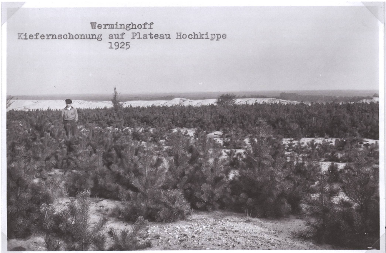
1 Kiefern-anforstungen auf dem Plateau der Hochkippe des Tagebaus Werminghoff, 1925.

er 1929 in der Monografie «Praktische Kulturvorschläge für Kippen, Bruchfelder, Dünen und Ödländereien» einem interessierten Fachpublikum. 12 Diese Abhandlung, die als erstes deutschsprachiges Rekultivierungsfachbuch gilt, 13 begründete Heusons Ruf als ausgewiesener Experte über das Lausitzer Revier und die politikhistorischen Zäsuren von 1933 und 1945 hinaus. 14 Seine empirisch basierten Forschungsergebnisse zählten auch für die Forschungen der 1950er- und 1960er-Jahre zu den Standardzitat, gleichwohl sie ausschliesslich auf verkippten Massen des ersten Flözes erzeugt und mithin für tertiäre Kippen des zweiten Flözes wenig aussagekräftig waren. Mochten Heusons Ergebnisse auch für die Forschungen nach 1945 wichtig gewesen sein, so markierte die «Landschaftsdiagnose der DDR» (1950/52), das erste nationale Umweltmonitoring weltweit, den Ausgangspunkt der Rekultivierungsforschung in der DDR. Initiiert wurde das Vorhaben von den überzeugten Sozialisten Reinhold Lingner (1902–1968) und Frank Erich Carl (1904–1994). Ziel war es, in einem ersten Schritt die Landschaftsschäden in der DDR zu erfassen und in einem zweiten, Verfahren zu ihrer Behebung zu entwickeln. Zur Realisierung der ambitionierten Idee griffen Lingner und Carl auf das Know-how nationalsozialistischer «Landschaftsanwälte» zurück. Die fünf Teilprojektleiter in den einzelnen Ländern waren vormalige Mitglieder der NSDAP oder deren Anwärter; 15 zu