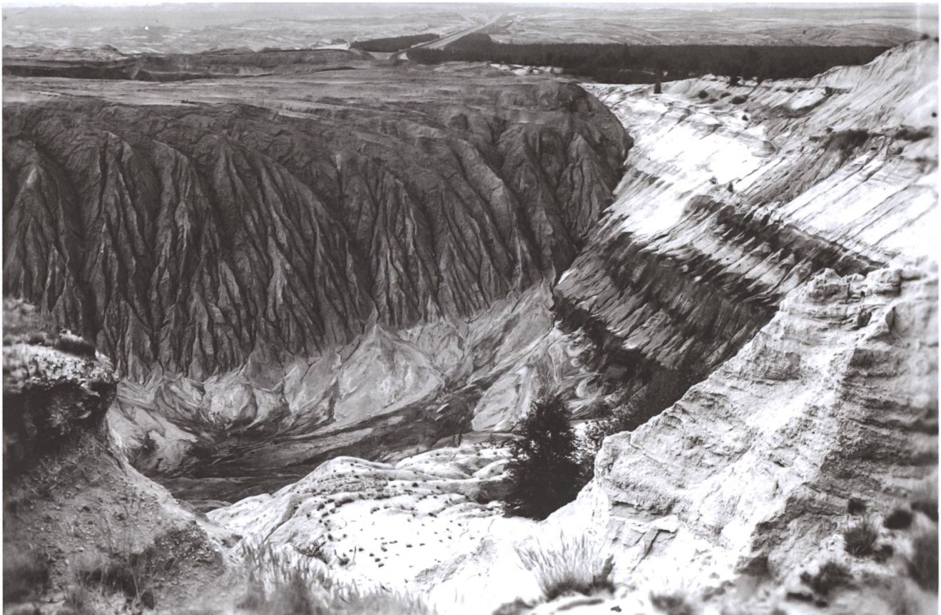
2 Kippenlandschaft bei Klettwitz, dokumentiert für die «Landschaftsdiagnose der DDR», 1949.

gnose» wundert wenig, da im Tagebau der Boden komplett abgetragen, der Wasserhaushalt bis zur Sohle der Grube gestört wird und die naheliegenden Kraftwerke und Veredelungsanlagen die Luft verunreinigen. Prominent hielten dies die Bearbeiter auch für die Situation im Mitteldeutschen Revier fest: