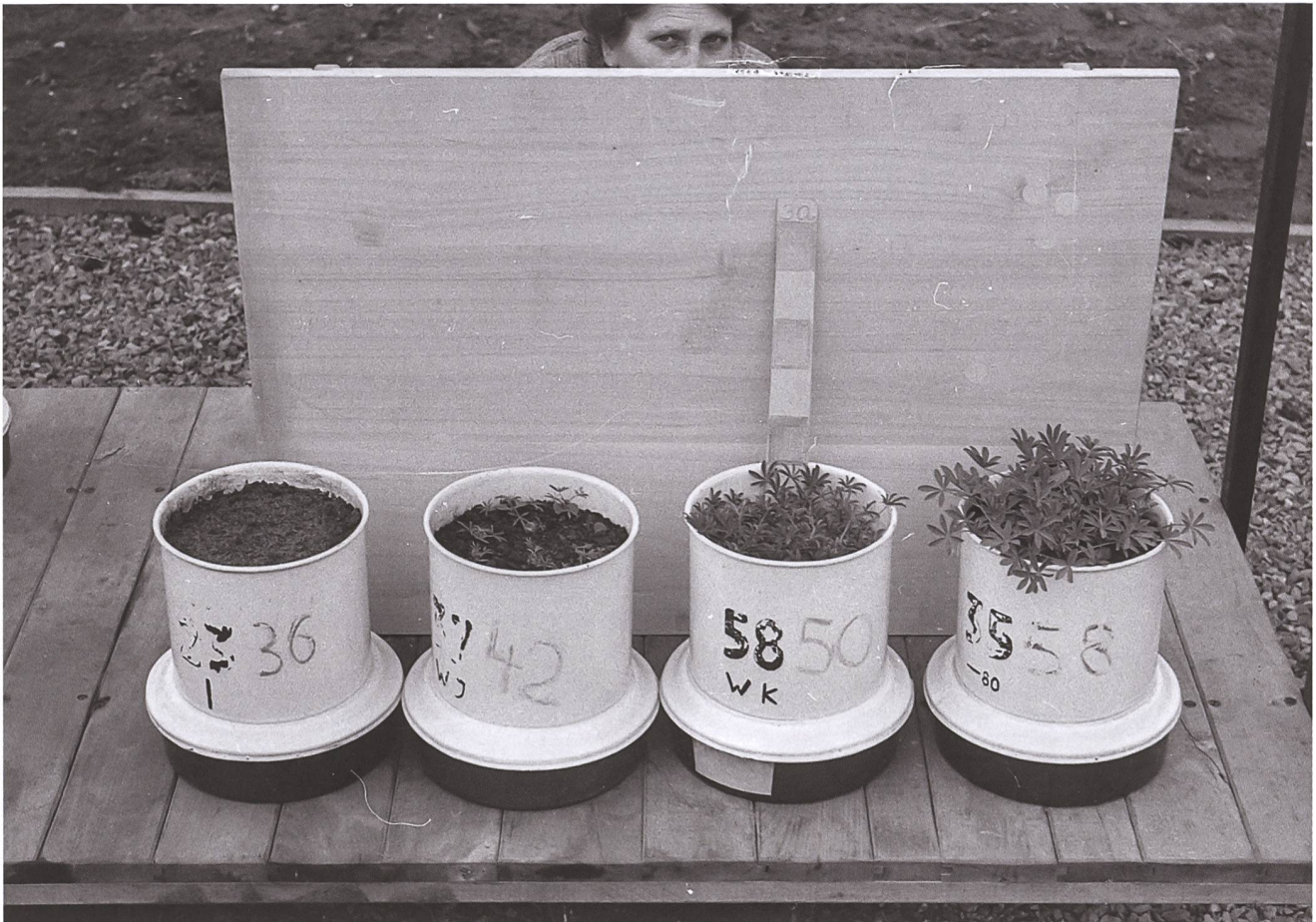
3 Versuchsreihe von Wilhelm Knabe mit Mitscherlich-Gefässen, 1952.

reiche Rekultivierungen zu identifizieren. Für seine Versuche setzte er Mitscherlich-Gefässe ein, die in den Landwirtschaftswissenschaften schon länger in Gebrauch waren, nun aber erstmals für die Belange des Bergbaus eingesetzt wurden. 26 1952 liess Knabe beispielsweise Abraum aus den Tagebauen Tatkraft und Niemtsch gewinnen. Diesen füllte er in die Gefässe und bestückte sie mit Pflanzen. Beigemengt wurden unterschiedliche Düngerqualitäten und -quantitäten, um durch den Vergleich des Pflanzenwachstums Rückschlüsse auf die angemessene Bodenmelioration des Unlandes ziehen zu können. 27