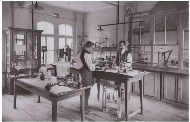
4 Jede Charge Rohstoffe, die geliefert wurde, musste analysiert werden: chemisches Labor, 1899.

rasch in Mitleidenschaft gezogen zu werden. Diese Massnahme hat sich nunmehr bewährt, indem uns zur Zeit genügend Rohmaterialien für die Fortführung des Betriebes zur Verfügung stehen.» 24 Die kriegführenden Mächte schränkten mit ihren Kontrollorganisationen «Société suisse de surveillance économique» (aufseiten der Entente) und «Schweizerische Treuhandstelle für Überwachung des Warenverkehrs» (für die Mittelmächte) die Bewegungsfreiheit der Schweizer Industrie aber zunehmend ein. 25 Um die Versorgung sicherzustellen, beteiligte sich GF an einer ganzen Reihe kriegsbedingter Gemeinschaftsunternehmen der Industrie, so unter anderem an der Schweizerischen Torfgesellschaft oder der neu gegründeten Studiengesellschaft für die Nutzbarmachung schweizerischer Erzlagerstätten. 26 Darüber hinaus ergriff GF weitere Massnahmen. Als Ersatzstoff für Kohle begann GF 1917 mit der Ausbeutung von Torffeldern in Ossingen (Kanton Zürich); 1918 wurden eine eigene Quarzgrube in Riedern sowie eine Sandgrube in Buchberg (Kanton Schaffhausen) in Betrieb genommen. 27 Wie schon früher der hauseigene Kalkstein fehlen auch diese Rohstoffe in den Bestellbüchern, wo offensichtlich nur externe Bestellungen bei Dritten festgehalten wurden.