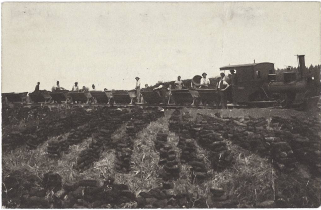
5 Torfgewinnung im Ersten Weltkrieg: Abtransport mit der Feldbahn, um 1916–1918.