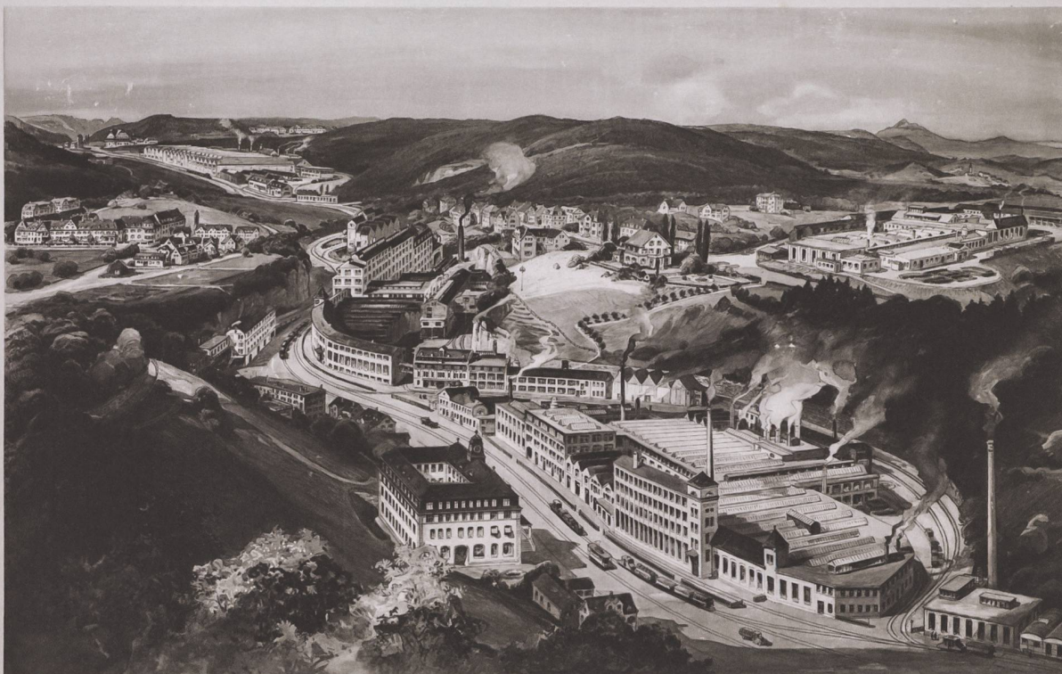
AKTIENGESELLSCHAFT DER EISEN- UND STAHLWERKE VORMALS GEORG FISCHER SCHAFFHAUSEN (SCHWEIZ)

2 Im engen Mühlental in Schaffhausen stehen die GF-Werke mit fortschreitender Expansion dicht an dicht (im Vordergrund die Stahlgießerei, oben rechts auf dem Geissberg die Elektrostahlwerke), um 1920.