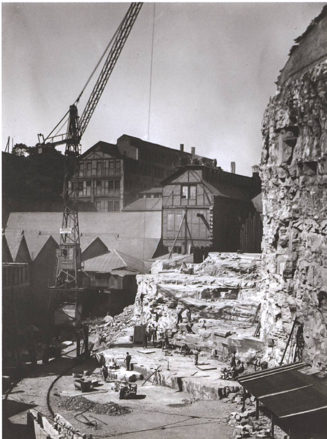
3 Der Kalksteinbruch von GF hinter der Tempergiesserei, 1930.