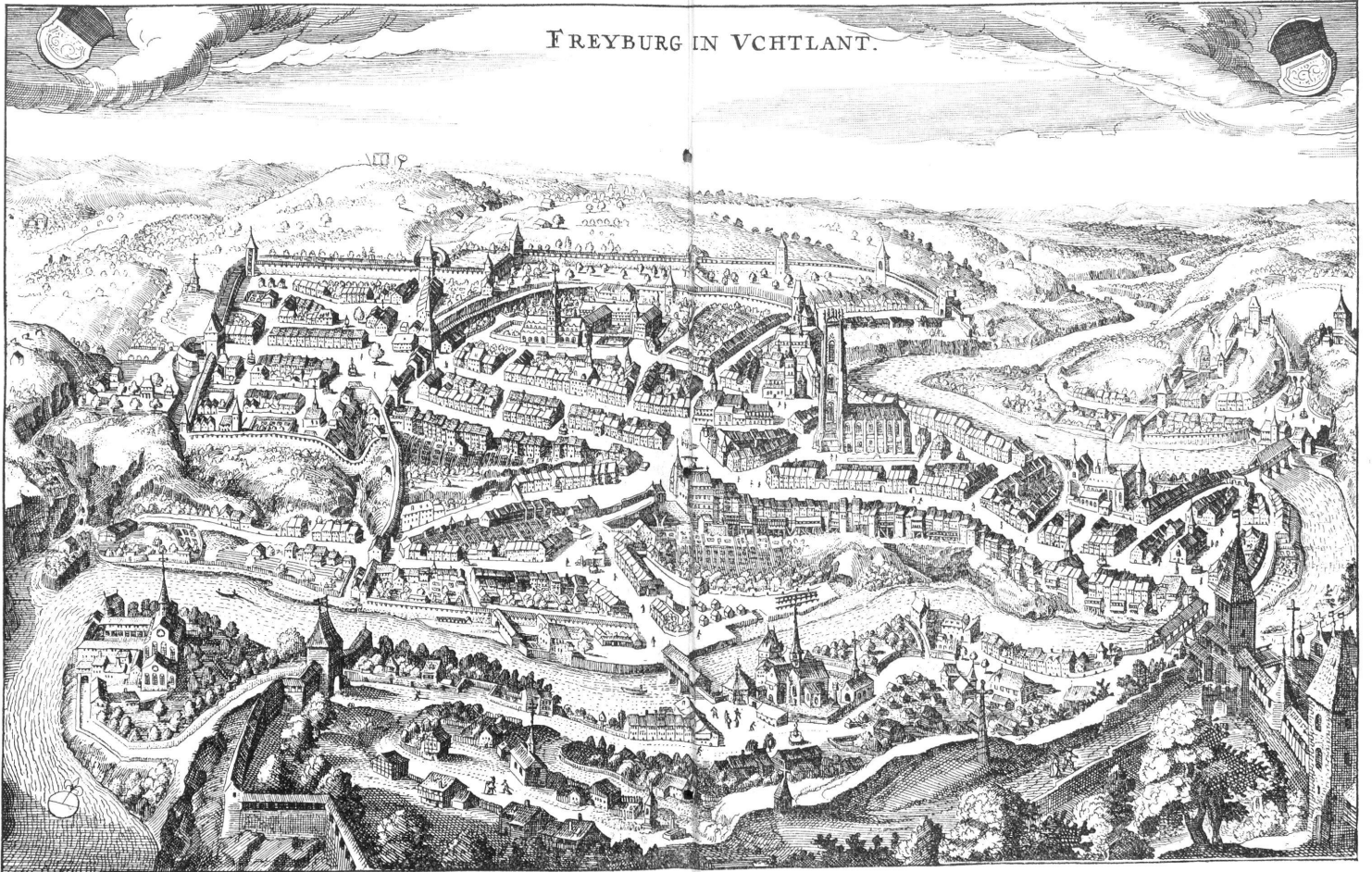
Freiburg. Nach Matthäus Merians Topographie, 1642.