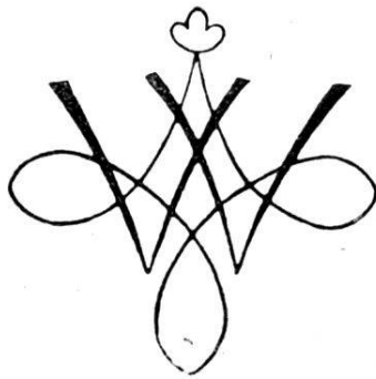
Familienmarke der Brandenburger zu Freiburg im Uechtland.

Der Vollständig- noch das Geschlecht ins Auge gefasst zeigt über ei-Baumstrunk, aus Flammen züngeln 4 . liesse sich an einen den Brandenburgern die Personalien der noch erreichbaren eine schlicht bürgerliche, ja bäuerliche Herkunft hinwiesen 5 .