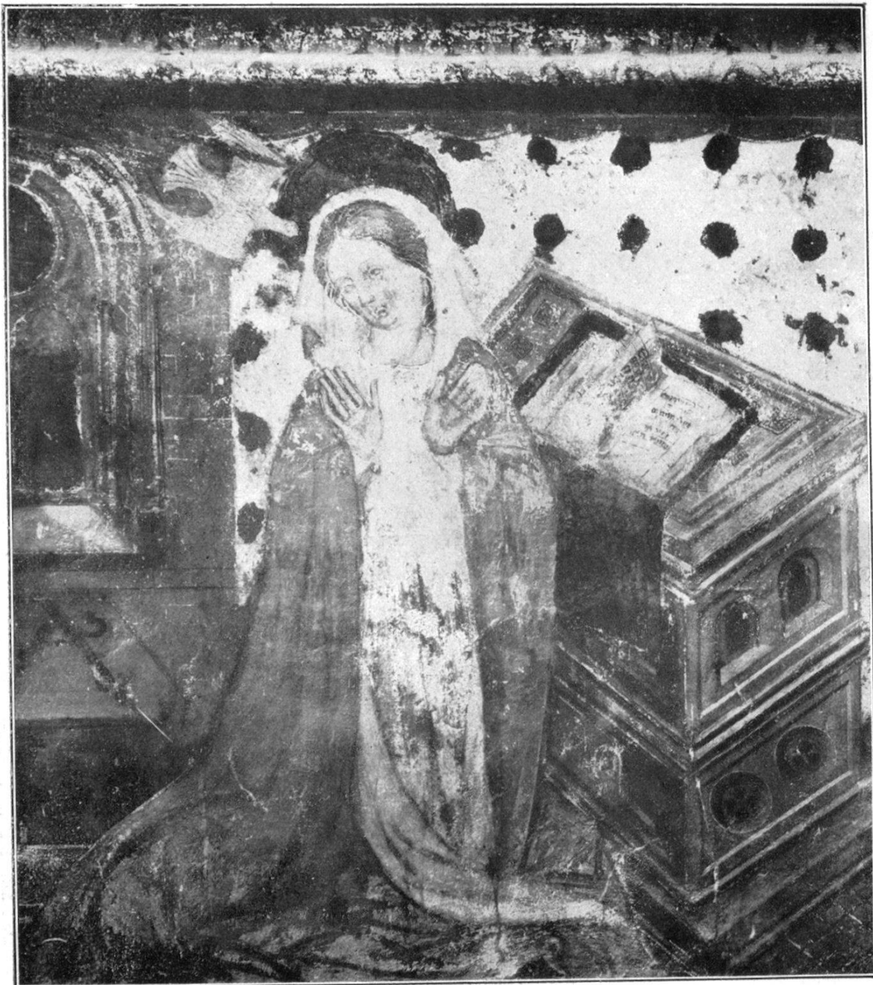
Tafel II. — Modonna aus den Fresken der Kirche zu Valeria (Taf. I).