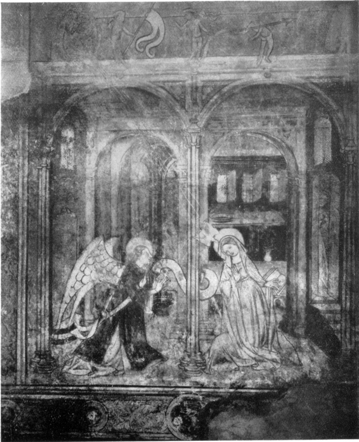
Tafel IV. — Verkündigung aus den Fresken in der Freiburger Franziskanerkirche.