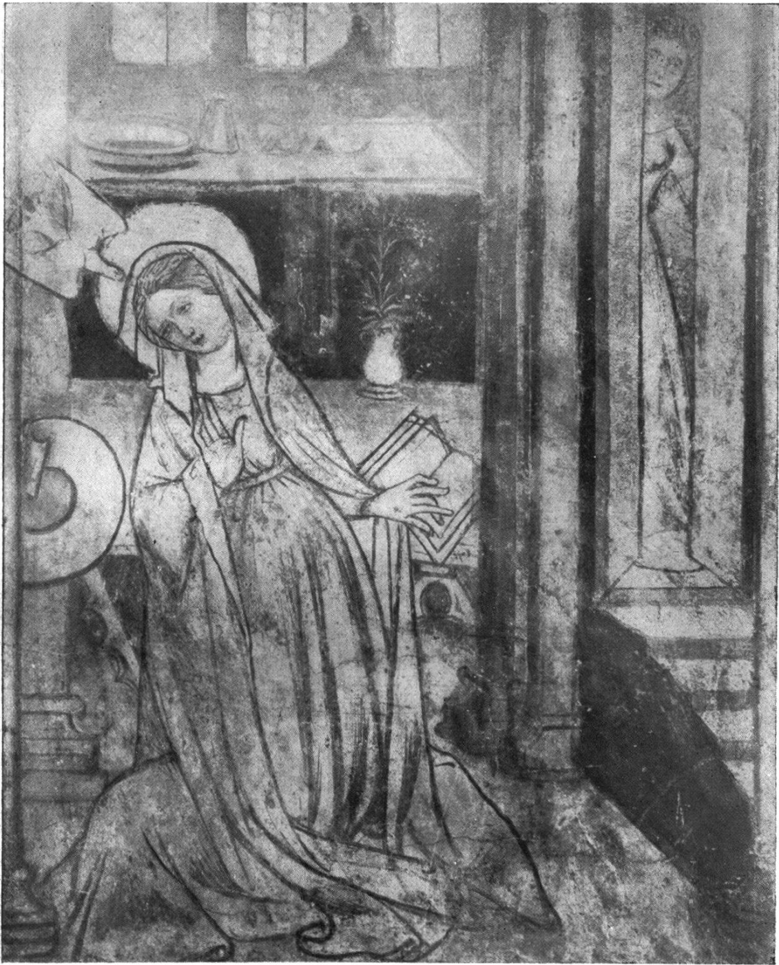
Tafel III. — Madonna aus der Verkündigung der Fresken in der Freiburger Franziskanerkirche (Taf. IV).