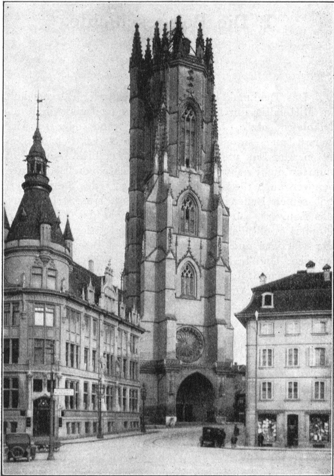
Abb. 1. Gesamtansicht der Kathedrale von Westen.