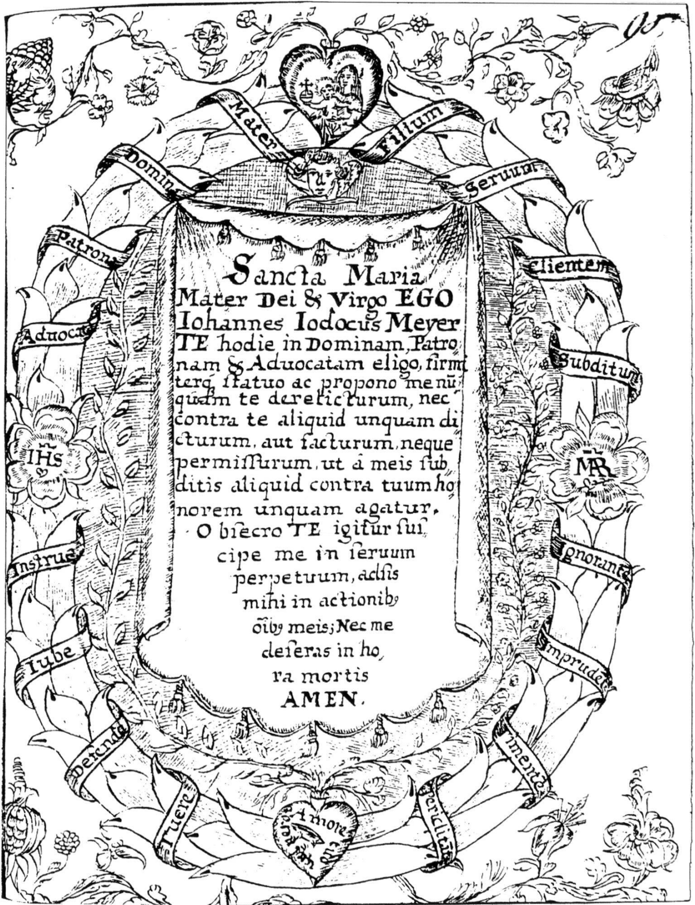
Abb. 3: Weiheformel der Großen Lateinischen Kongregation am Kollegium in Freiburg, Ausfertigung von Johann Jodoc Meyer, um 1635/1640. – Freiburg, Kantons- und Universitätsbibliothek, L 54, fol. 96.