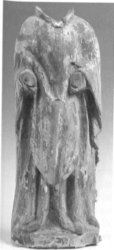
Abb. 7 (links): Fragment eines Diakons (Stephanus?), um 1400, Jaun, Neue Pfarrkirche.