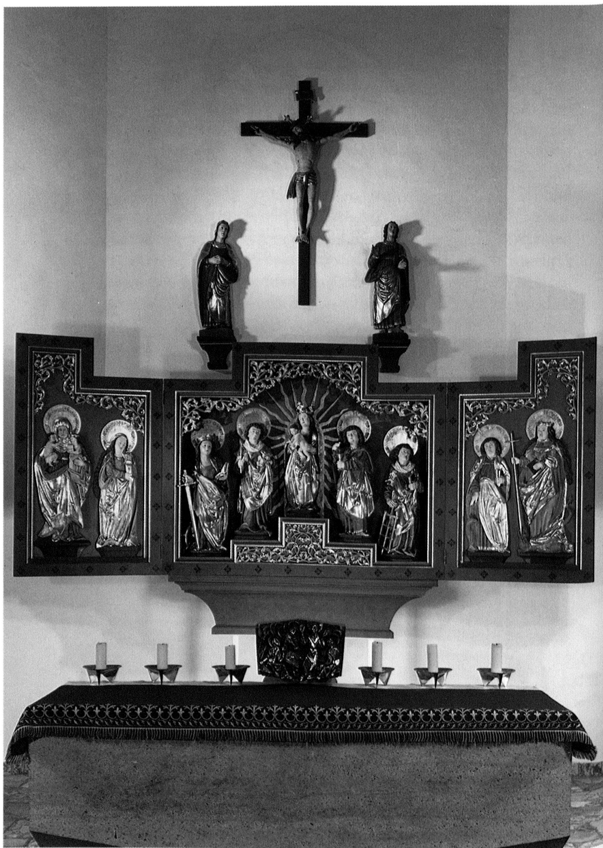
Abb. 2: Jaun, Neue Pfarrkirche, Hochaltaretabel von 1964 mit spätmittelalterlichen Skulpturen und Reliefs (Zustand um 1965).