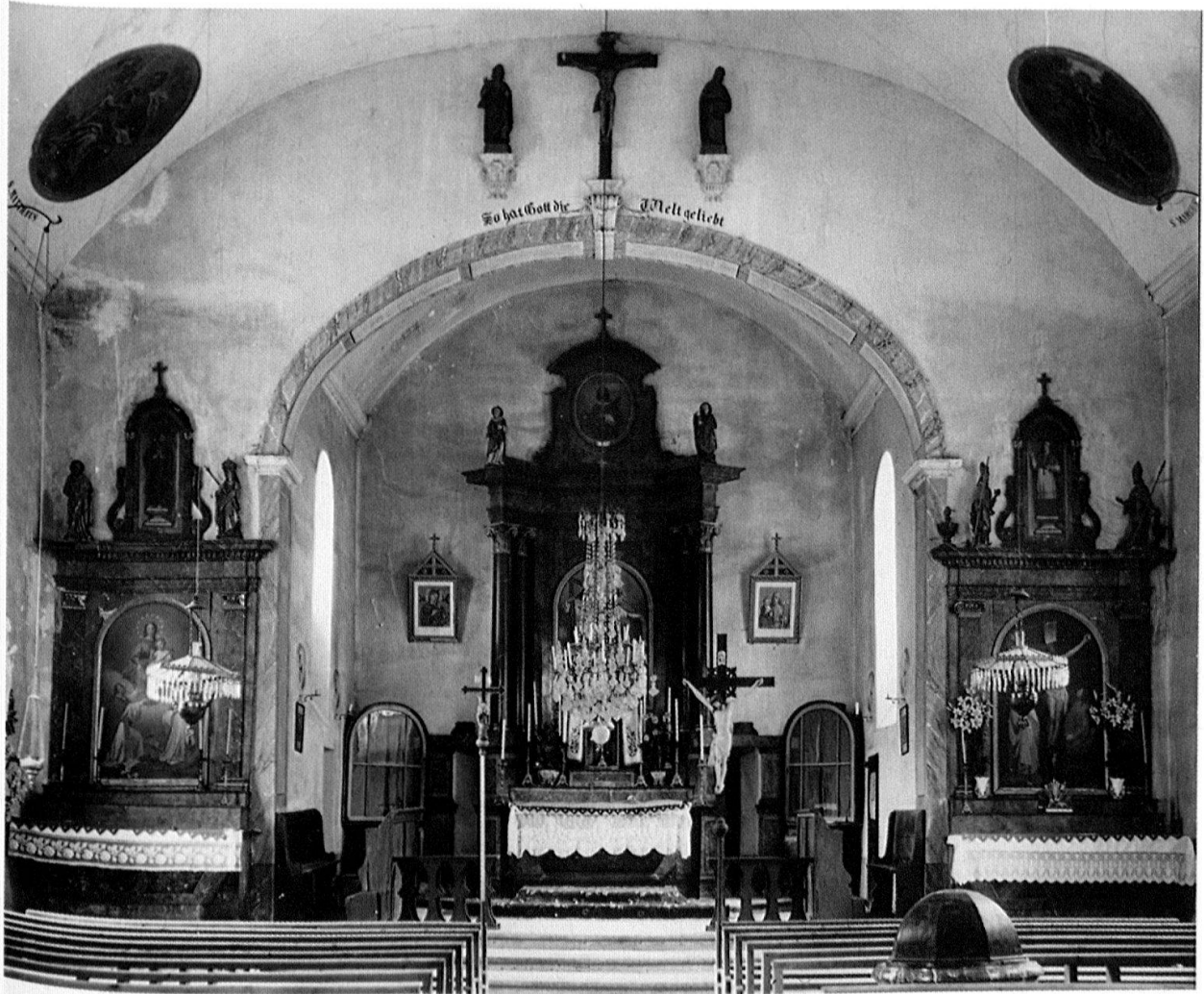
Abb. 3: Jaun, Alte Pfarrkirche (Zustand um 1906).