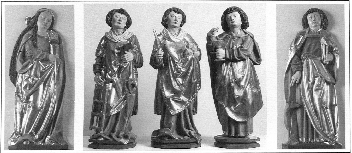
Abb. 6: Hochaltarretabel der Alten Pfarrkirche Jaun, 1515, Rekonstruktionsversuch.