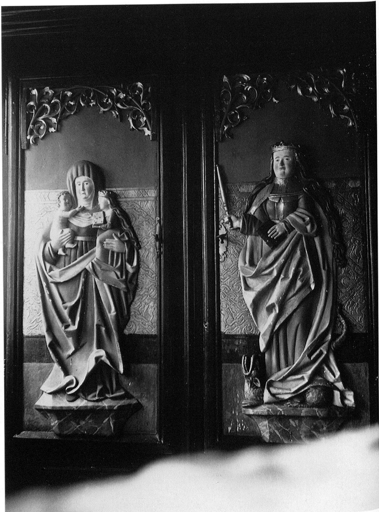
Abb. 4: Als Schranktüren wiederverwendete Retabelflügel in Privatbesitz von Alfons Buchs-Schuwey, Jaun (Zustand um 1940).