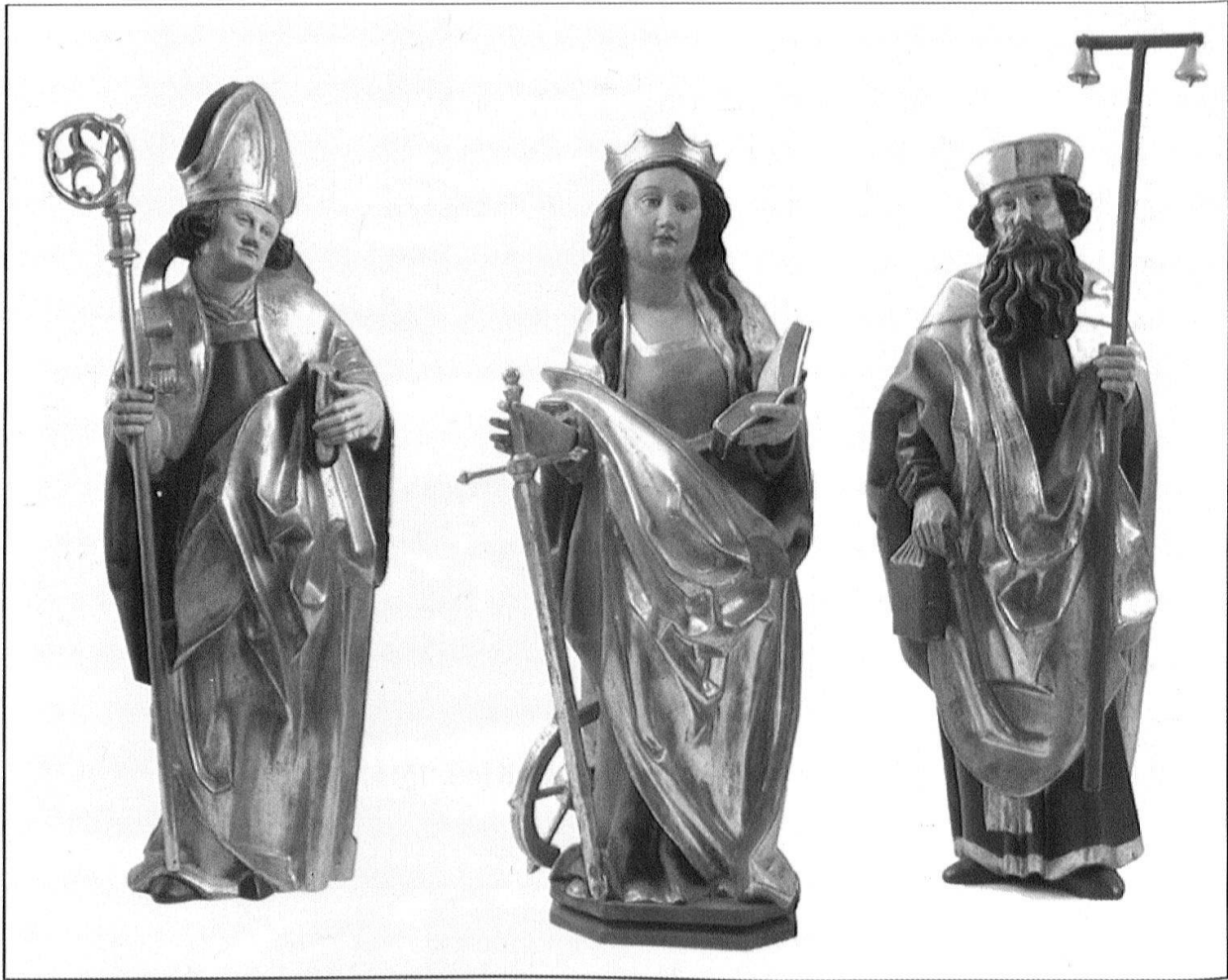
Abb. 10: Katharinenretabel der Alten Pfarrkirche Jaun, 17. Jh., Rekonstruktionsversuch.