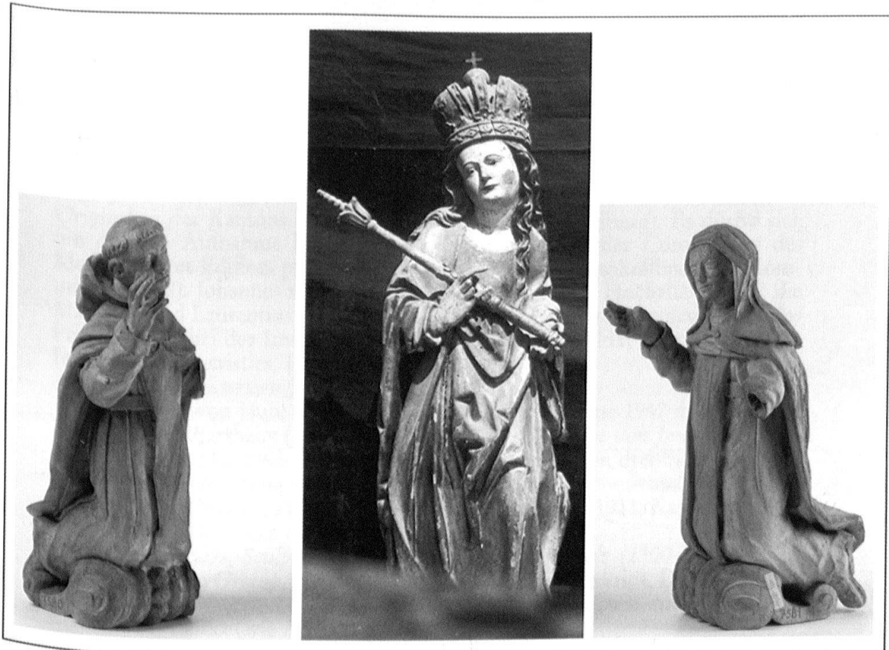
Abb. 9: Rosenkranzretabel, Mitte 17. Jh., Rekonstruktionsversuch (Madonna mit barocken Veränderungen im Zustand um 1930, Begleitfiguren im aktuellen Zustand) (Foto Primula Bosshard).