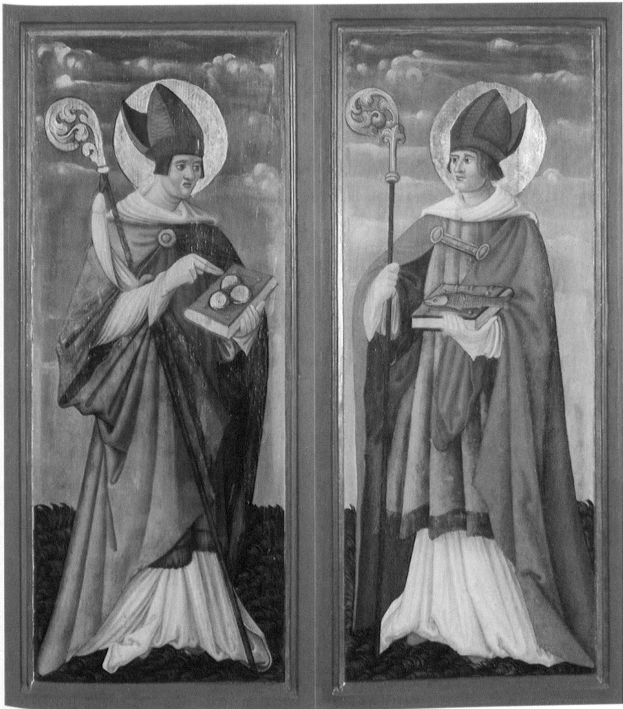
Abb. 5: Retabelflügel, 17. Jh.?, Jaun, Neue Pfarrkirche.