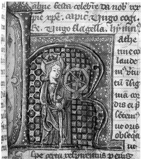
Abb. 1: Initiale mit Miniatur der hl. Katharina im Brevier des Freiburger Pfarrers Wilhelm Studer (1412–1447). Kantons- und Universitätsbibliothek Freiburg, Handschrift L 30, f. 338r.