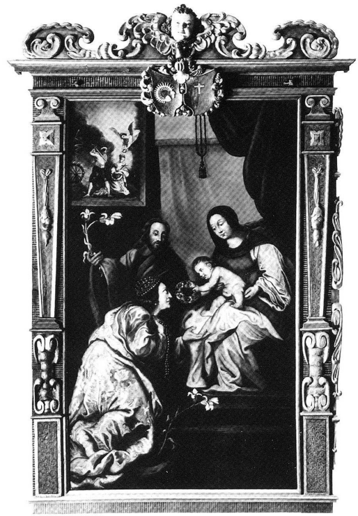
Abb. 9: Mystische Vermählung der hl. Katharina mit dem Jesuskind, 2. Viertel 17. Jh. Franz Reiff (?). Öl auf Leinwand. Kathedrale St. Nikolaus, Freiburg. Abb. aus STEINAUER (Hg.), Saint Nicolas (wie Anm. 2), S. 149.