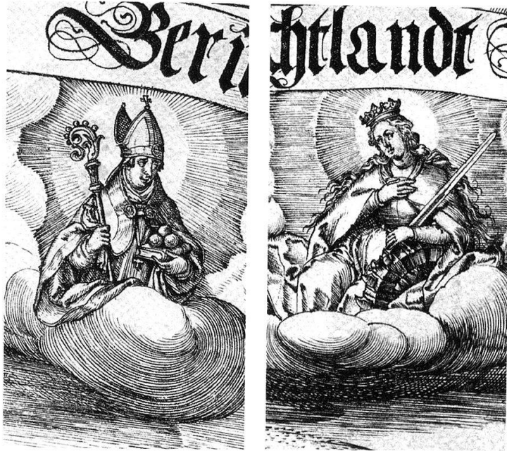
Abb. 6: Hl. Nikolaus von Myra und hl. Katharina von Alexandria (Details aus der grossen Freiburger Stadtansicht), 1606. Martin Martini, Kupferstich. Museum für Kunst und Geschichte, Inv. 1999–1777.