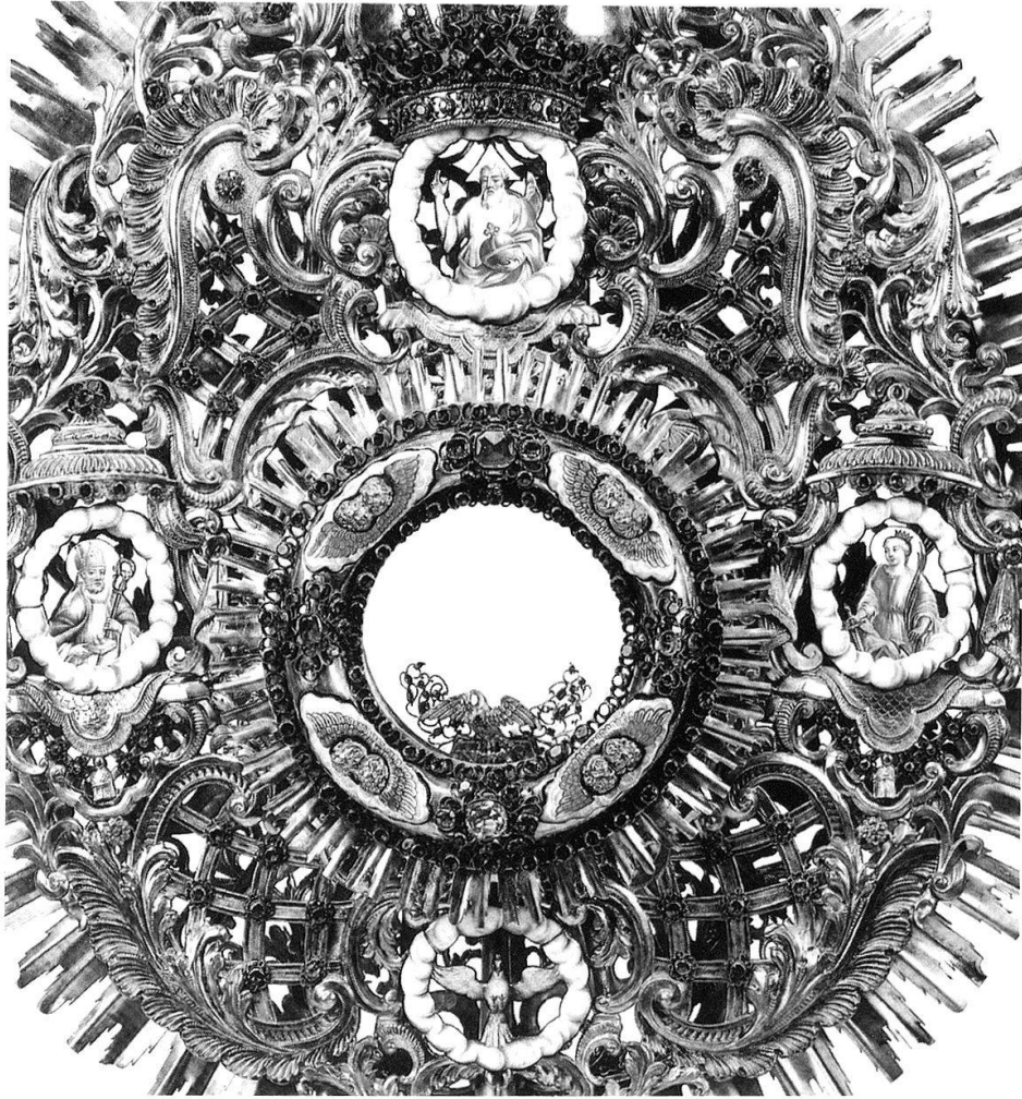
Abb. 10: Die hll. Nikolaus und Katharina. Grosse Monstranz, 1745, Jacques-David Müller. Silber, Gold, Email, Edelsteine. Stiftskapitel St. Nikolaus, Freiburg. Abb. aus: STEINAUER (Hg.), Saint Nicolas (wie Anm. 2), S. 131.

Abb. 11: Pendulenförmiges Tafelreliquiar mit verschiedenen Reliquien. Louis XV, 2. Hälfte 18. Jh. Die Reliquien der heiligen Odilo, Stefan, Katharina, der Märtyrer der Thebäischen Legion und vom Heiligen Grab sind in Gaze oder weissen Stoff gewickelt und mit Silberfäden, Glasperlen und Pailletten versehen. Abb. aus: Trésor de la Cathédrale Saint-Nicolas de Fribourg (wie Anm. 36), S. 134.