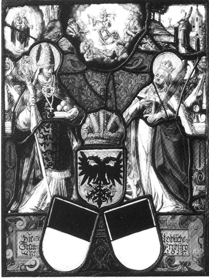
Abb. 8: Wappen der Stadt Freiburg, 1623. Hans Weber (Zuschr.). Farbglas, Schwarzlot, Blei. Museum für Kunst und Geschichte Freiburg, Inv. 3498. Abb. aus: STEINAUER (Hg.), Saint Nicolas (wie Anm. 2), S. 150.