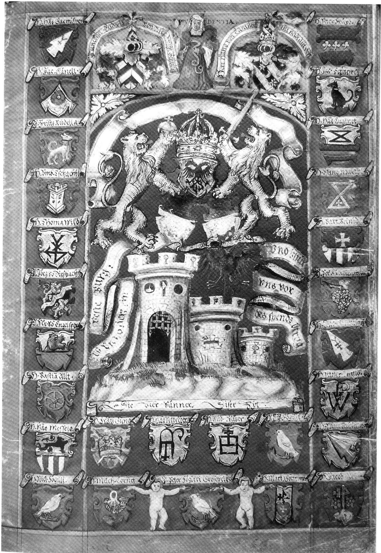
Abb. 4a: Katharinenbuch, Titelblatt. Staatsarchiv Freiburg, Stadtsachen A 596.