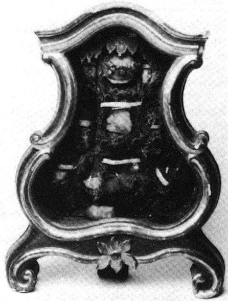
Abb. 11: Pendulenförmiges Tafelreliquiar mit verschiedenen Reliquien. Louis XV, 2. Hälfte 18. Jh. Die Reliquien der heiligen Odilo, Stefan, Katharina, der Märtyrer der Thebäischen Legion und vom Heiligen Grab sind in Gaze oder weissen Stoff gewickelt und mit Silberfäden, Glasperlen und Pailletten versehen.