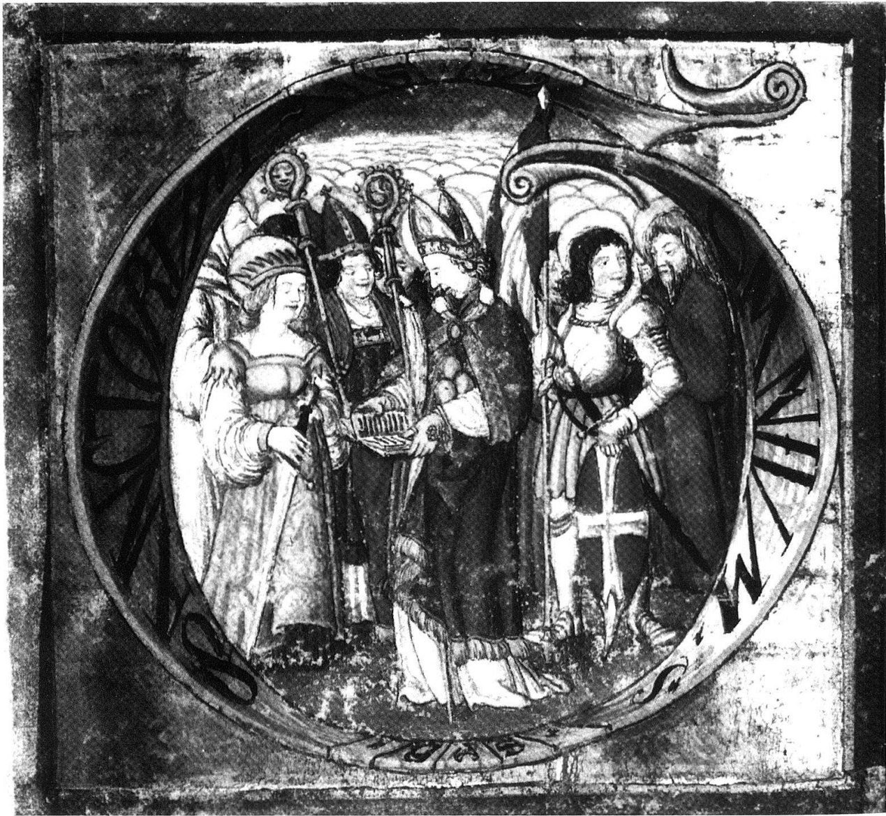
Abb. 3: Historisierte Initiale für Allerheiligen, datiert 1539, mit Darstellung der Freiburger Heiligen: Katharina, Augustinus, Nikolaus von Myra, Mauritius und (vielleicht) Nikolaus von Flüe. Kantons- und Universitätsbibliothek Freiburg, Hs. L 516, f. 59r (Ausschnitt). Einladungskarte Kantons- und Universitätsbibliothek, 27. Okt. 2006.