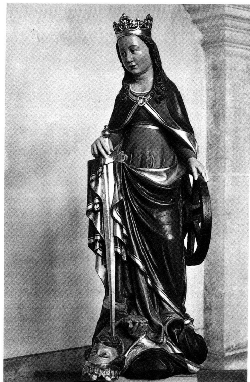
Abb. 2: Statue der hl. Katharina von ca. 1425. Zisterzienserinnenkloster Magerau.