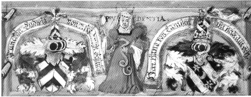
Abb. 4b: Katharinenbuch, Titelblatt, (Detail, Prudentia).