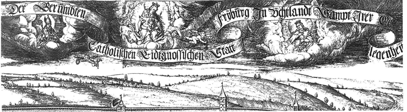
Abb. 5: Die hll. Nikolaus und Katharina, in der Mitte die Grossmutter. Detail aus der grossen Freiburger Stadtansicht des Martin Martini, 1606.