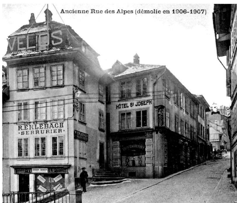
Ill. II: L'auberge du Saint-Joseph avant sa démolition en 1906, carte postale, 9×14cm, Prosper Macherel, BCUF, collection des cartes postales.

de Boccard 45 , elle-même transformée en habitation avant 1854 par la veuve d'Ignace de Montenach et sa fille 46 .