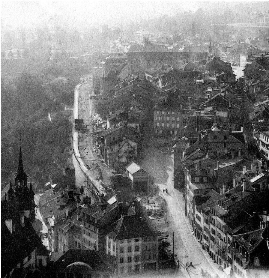
Ill. IV: La route des Alpes en construction et la démolition des maisons du Petit-Paradis et de la rue des Alpes, 1906, carte postale, 9 x 14 cm, Musy frères éditeurs, Lausanne, [1906], détail, AEF, Photographies 5227 B..

pace compris entre la maison Forestier et le croisement de la rue des Alpes et de la route du même nom. Un no man's land, à tel point que durant de longues années, on ne parle plus du Petit-Paradis et que les maisons subsistantes sont intégrées à la rue des Alpes. Ce n'est que récemment qu'on a restitué à deux ou trois maisons l'adresse du Petit-Paradis. Quant à l'espace se situant en dessous de la fontaine, il a été converti en lieu de parcage pour les automobiles et la plate-forme de la fontaine est un endroit où tout un chacun vient déposer ses détritits. On en vient presque à rêver du ravin du Petit-Paradis et de ses lieux d'aisances... Paradise lost.