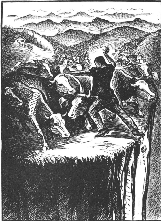
Eine Kuhherde von zwanzigtausend Stück jährlich nutzlos geopfert!

Um diese metaphorische Sprache noch anschaulicher und nachvollziehbarer zu machen, druckte der Volkskalender auch gleich noch grossformatig eine einprägsame Illustration dieses Gleichnisses ab.