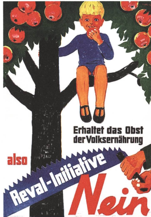
Abb. 7: Alkoholpolitik in Zeiten des Weltkriegs. Abstimmungsplakat der Gegner der REVAL-Initiative, die 1941 zur Abstimmung gelangte und abgelehnt wurde.

Auch wenn die REVAL-Initiative schliesslich auf nationaler Ebene deutlich verworfen wurde, zeigt die Polarisierung der Befürworter und Gegner sowie die Militanz des Abstimmungskampfes, dass die schweizerische Öffentlichkeit keineswegs jener in einer «nationalmetaphysischen Sonderfallideologie» geeinten Nation entsprach, als welche man sie rückblickend auf die Kriegsjahre zu stilisieren pflegte 95 . Während sprachgewaltige Wortführer angesichts von aussenpolitischen Bedrohungsgefühlen und Unsicherheiten die