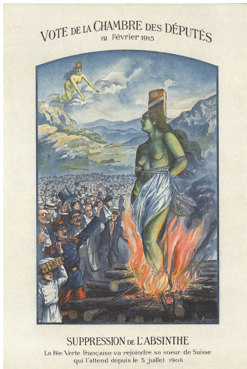
Abb. 4: Das Absinthverbot in der Schweiz entwickelte eine internationale Strahlkraft und galt bei vielen zeitgenössischen Abstinenzbewegungen im Ausland als Vorbild für ähnliche Prohibitionsbemühungen.

in der deutschsprachigen Zentral- und Ostschweiz, wo der Absinth in der Alltagskultur so gut wie gar keine Rolle spielte.