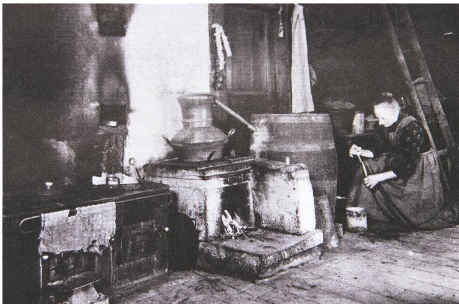
Abb. 1: Das Schnapsbrennen war in den ländlichen Unterschichten im 19. und frühen 20. Jahrhundert eine weitverbreitete Tätigkeit. Undatierte Fotografie aus dem Archivbestand der Eidgenössischen Alkoholverwaltung.

tiefe lebensweltliche Einschnitte bewirkte und die Trinkkulturen veränderte. Ähnlich wie dies Engels mit Blick auf das englische Industrieproletariat tat, begannen in der Schweiz Schriftsteller wie Jeremias Gotthelf oder Heinrich Zschokke die Omnipräsenz des Alkohols und den Wandel der Trinkkulturen in den ländlichen und städtischen Unterschichten literarisch und volkspädagogisch zu bearbeiten: Gotthelf etwa in seiner Erzählung mit dem sprechenden Titel Wie fünf Mädchen im Branntwein jämmerlich umkommen und Zschokke mit seinem nicht minder Furore machenden Buch Die Branntweinpest 12 .