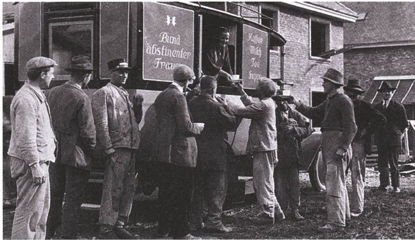
Abb. 3: Der 1902 gegründete Schweizerische Bund abstinenter Frauen gehörte zu den wichtigsten Vereinen der Abstinenzbewegung.