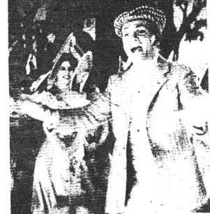
Yankee Doodle Dandy