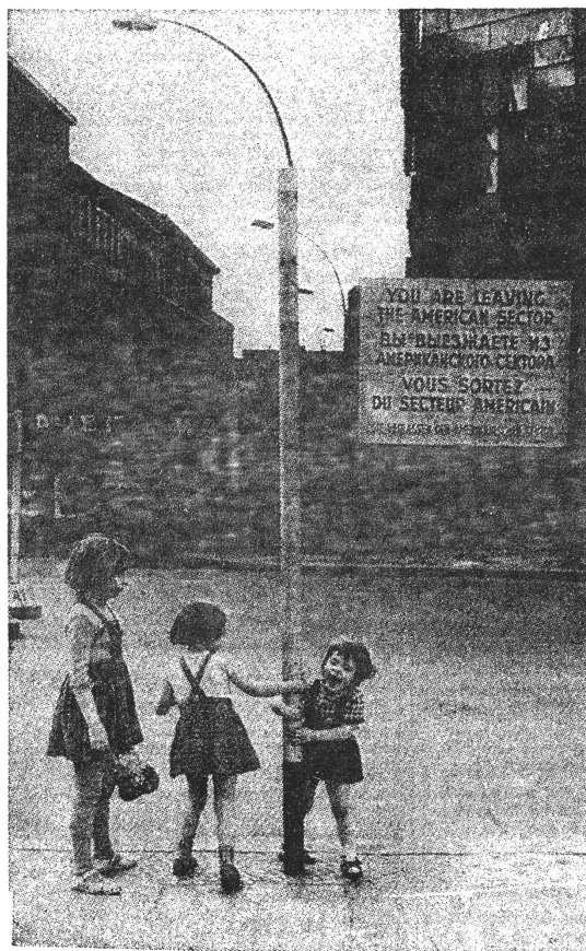
An der Sektorengrenze

Vieles erinnert auch in Berlin an den Krieg - dreissig Jahre darnach. Und die Mauer erschreckt immer noch. Diese 'Insel'-Grosstadt hat viel ab-