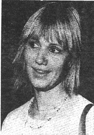
MIOU-MIOU nennt sich die Hauptdarstellerin des französischen Festspielbeitrags „F wie Fairbanks“