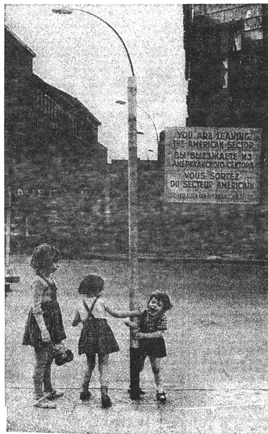
An der Sektorengrenze

Vieles erinnert auch in Berlin an den Krieg - dreissig Jahre darnach. Und die Mauer erschreckt immer noch. Diese 'Insel'-Grosstadt hat viel ab-