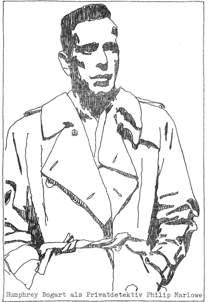
Humphrey Bogart als Privatdetektiv Philip Marlowe