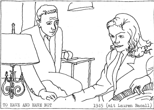
TO HAVE AND HAVE NOT