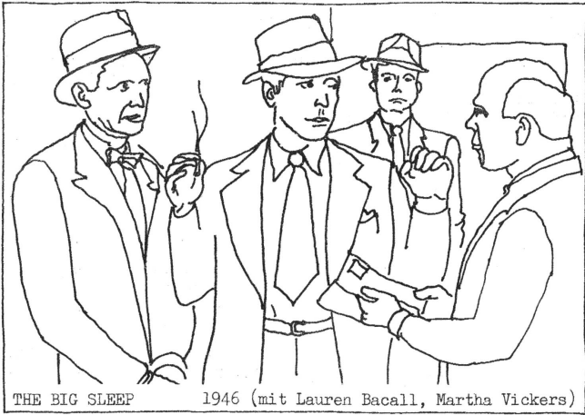
THE BIG SLEEP 1946 (mit Lauren Bacall, Martha Vickers)