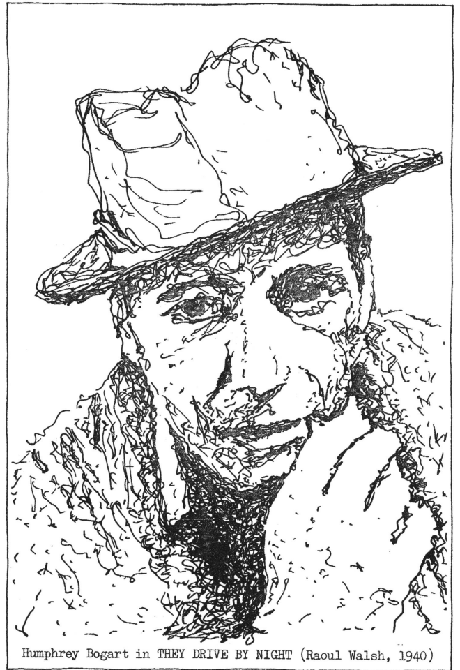
Humphrey Bogart in THEY DRIVE BY NIGHT (Raoul Walsh, 1940)

1929 ging Bogart nach Hollywood, in der Absicht, die Hauptrolle im Film THE MAN WHO CAME BACK zu spielen. Seine Freunde, die ihn am Bahnhof begrüßten, lachten, als sie das hörten: sie waren mit demselben Angebot in die Filmstadt gelockt worden. Schliesslich aber übernahm wenigstens Bogarts Stimme die Hauptrolle im Film; er lieh sie dem Stumm-