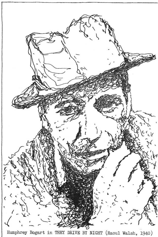
Humphrey Bogart in THEY DRIVE BY NIGHT (Raoul Walsh, 1940)

1929 ging Bogart nach Hollywood, in der Absicht, die Hauptrolle im Film THE MAN WHO CAME BACK zu spielen. Seine Freunde, die ihn am Bahnhof begrüßten, lachten, als sie das hörten: sie waren mit demselben Angebot in die Filmstadt gelockt worden. Schliesslich aber übernahm wenigstens Bogarts Stimme die Hauptrolle im Film; er lieh sie dem Stumm-