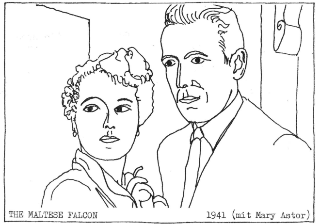
THE MALTESE FALCON 1941 (mit Mary Astor)