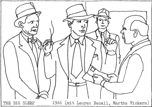
THE BIG SLEEP

1946 (mit Lauren Bacall, Martha Vickers)