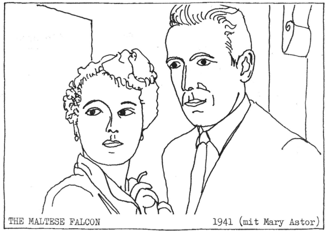
THE MALTESE FALCON