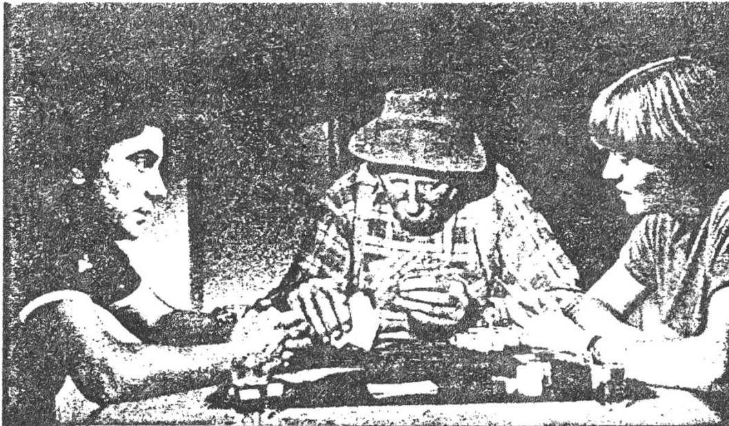
LES PETITES FUGUES