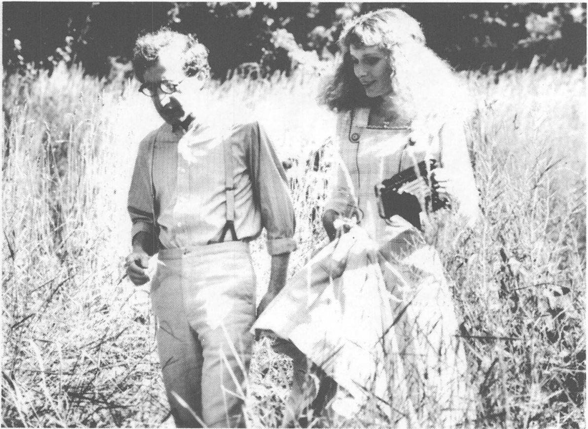
Woody Allens fröhliche "Règle du Jeu en américain" – bei Felix Mendelssohn Musik – macht zitierend Gebrauch: warum nicht Manet "Frühstück im Freien"?