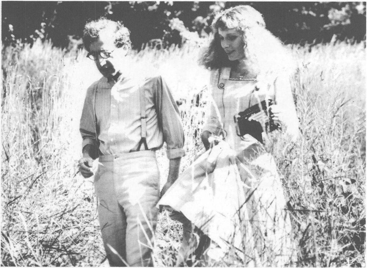
Woody Allens fröhliche "Règle du Jeu en américain" – bei Felix Mendelssohn Musik – macht zitierend Gebrauch: warum nicht Manet "Frühstück im Freien"?