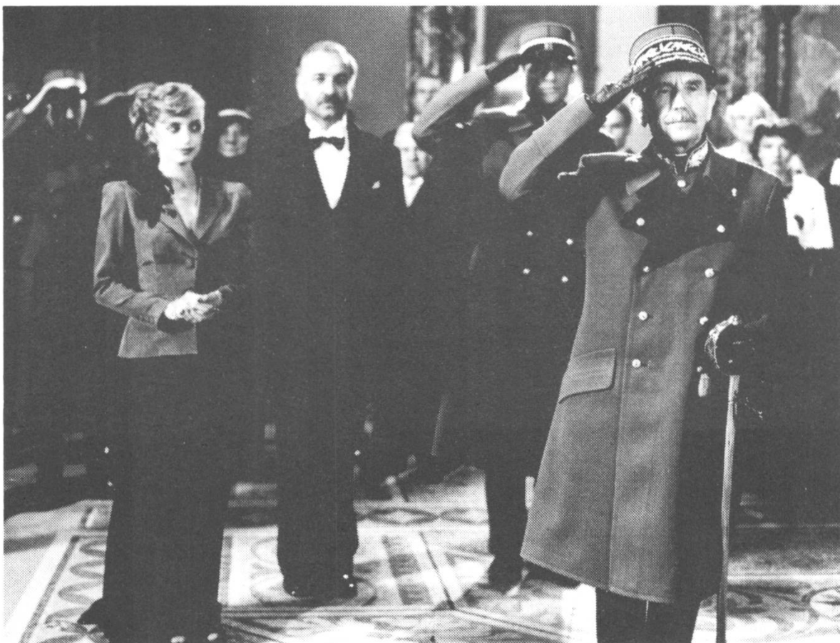
Szene 79 (Aussen / Dämmerung / Vorplatz): Der General steht grüssend ...

Donnerstag, den 13. Januar 1983: 9. Drehtag bei Thomas Koerfers neuem Spielfilm GLUT IM HERZEN (Arbeitstitel). Laut Tagesdisposition ist der allgemeine Arbeitsbeginn auf 13.30 Uhr angesetzt - Filmer müsste man sein, mag manch einer denken; immerhin ist Vorsicht geboten: "Drehschluss ca. 24 Uhr" -; Drehbeginn um 15 Uhr beim Schloss Castel in der Nähe von Tägerwilen ob Kreuzlingen am Bodensee. Gedreht werden die Szenen 79, 82 und 87 - oder eben: "die Ankunft des Generals". 79 (Aussen / Dämmerung / Vorplatz): "Die Villa Korb in gedämpfter Festbeleuchtung, zur Feier des Generalsempfangs. Der trotz Winterkälte offene Dienstwagen des Generals ist vorgefahren. Die Gäste, unter ihnen viele hohe Militärs, bilden unter dem Dach ein Spalier. Oben an der Treppe die Gastgeber: Claire Korb ist überwältigend anzusehen. Der etwas abseits stehende Chor stimmt die Landeshymne an ... Der General steht grüssend, Hand an der Schirmmütze." (nach Drehbuch) Regie und Equipe verlassen kurz nach eins das Hotel; aber ab 10 Uhr wurden in Garderobe und Maske bereits "fünf weibliche Gäste", ab 10 Uhr 30 "sechs männliche Gäste", dann "vier Wachen, der Adjutant des Generals, sechs Offiziere und ein Leutnant" ausgestattet und hergerichtet, hatte der Darsteller des Generals, Robert Tessen, eine Maskenprobe. Die Hauptdarstellerin Katharina Thalbach ging kurz nach elf zu Garderobe und Maske.