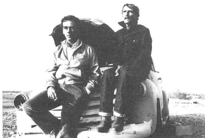
... zur Erfahrung, zur Flucht, zur Rückkehr ...