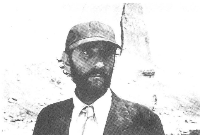
Reisen wird zum drängenden Impuls ...