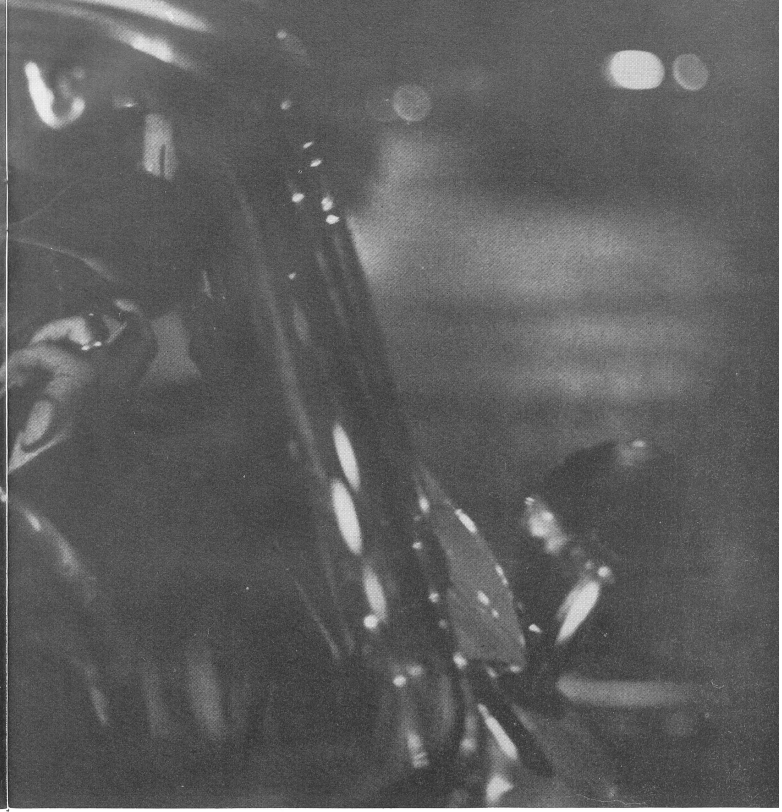
Dennis Hopper in DER AMERIKANISCHE FREUND