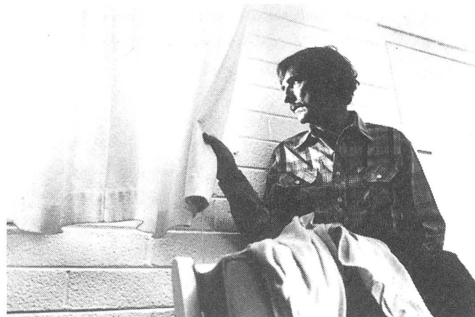
... zu einem Zurücktasten in die eigene Vergangenheit.