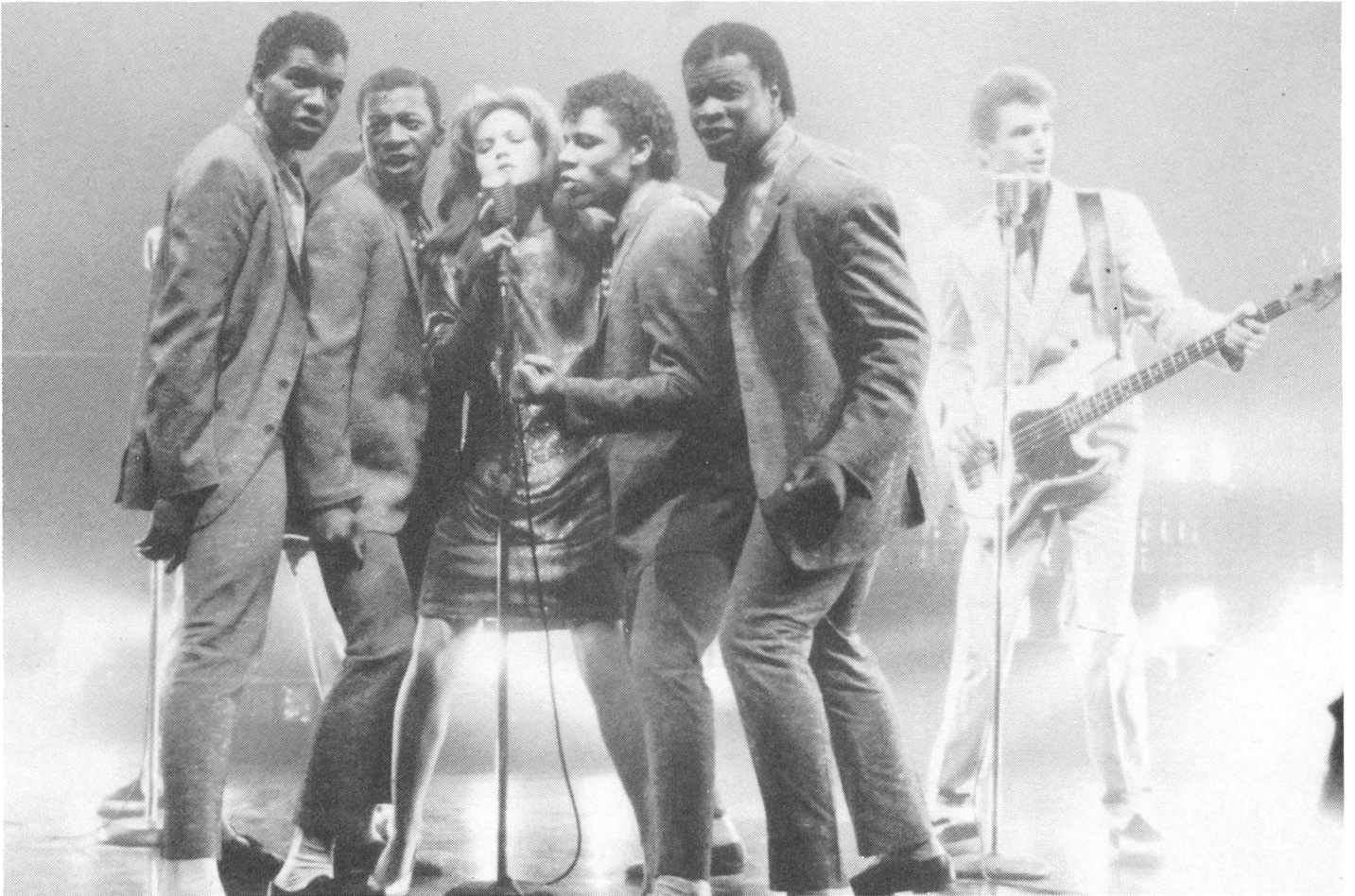
Wirklich ist, was gezeigt wird: Oberflächen vertreten Welten, Rhythmen sorgen für Tempo, Licht schafft Tiefe