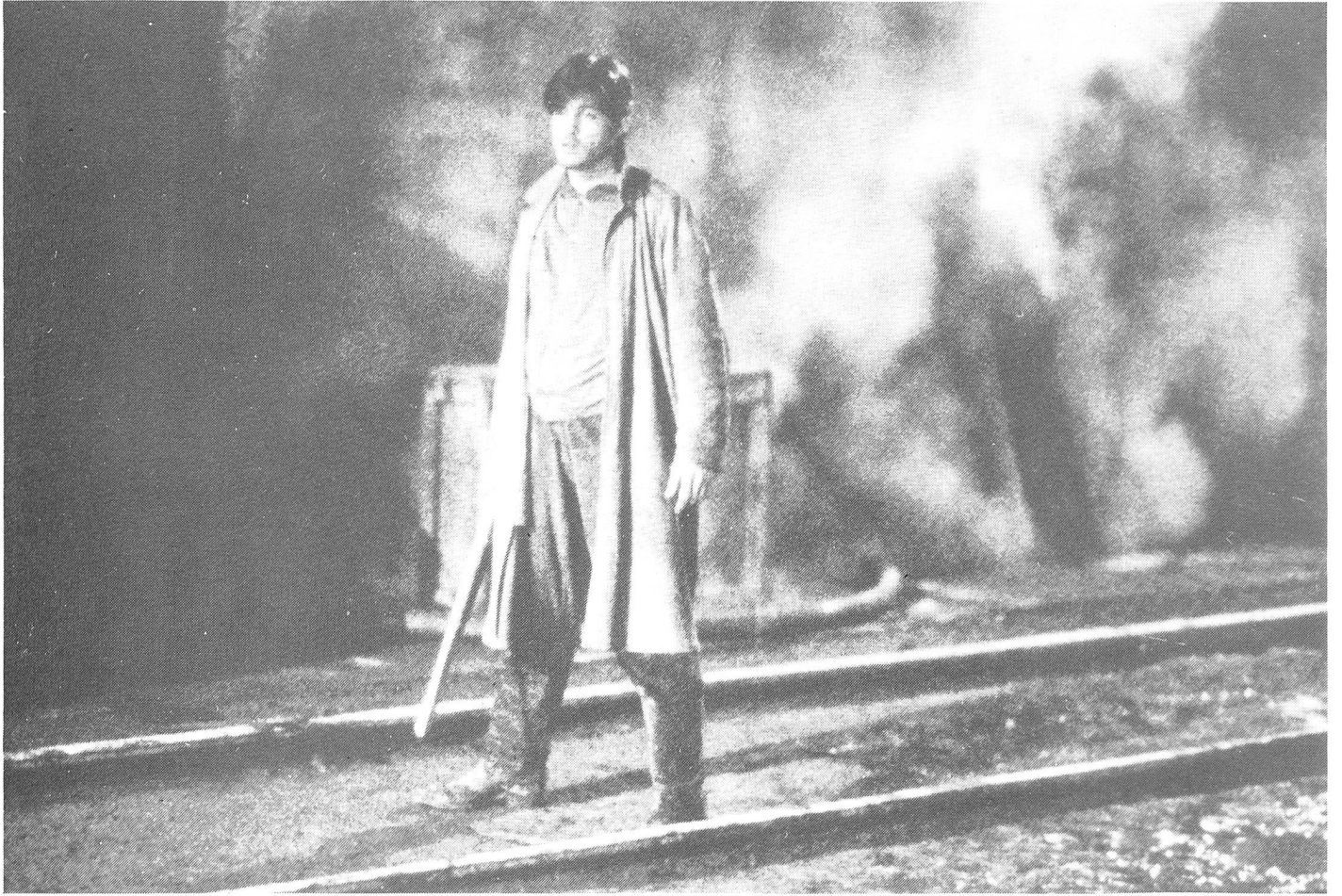
Das Abenteuer der Zeichen. Wo die Kleidung über den Charakter dominiert. Und die Accessoires über den Typ.