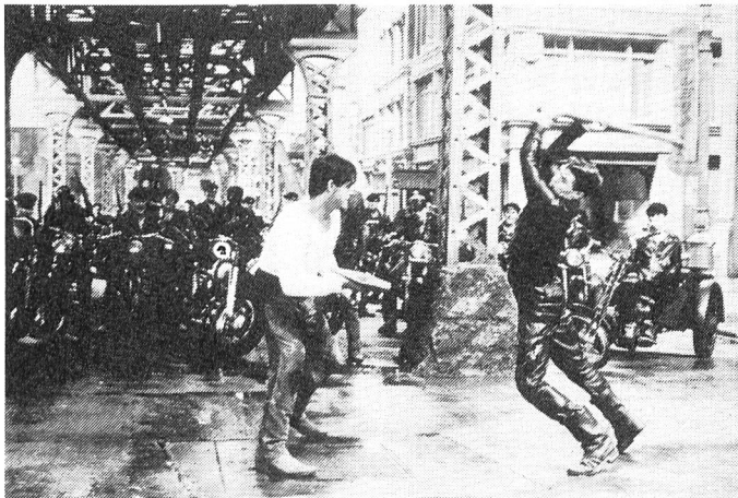
Körperkämpfe haben klare Sieger