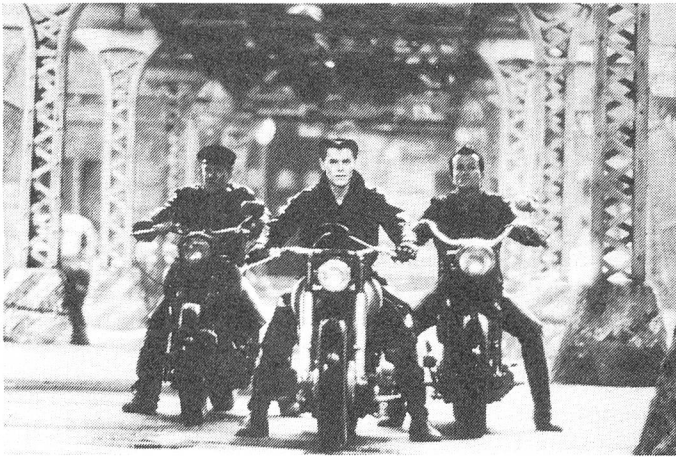
Erzählt wird vom Sieg des Guten über den Bösen.