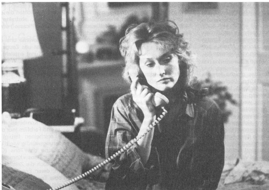
Meryl Streep als Molly Gilmore