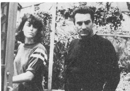
zärtliches Beisammensein ...