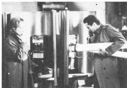
Zufällige Begegnungen ...

vorgesehenen Geschenke zu vertauschen. Nachdem sie nun auf der Treppe des New Yorker Bahnhofs geklärt haben, warum seine Ehefrau ein Segelbuch unter dem Christbaum fand und ihr Ehemann einen Gartenbauband, trennen sie sich wieder. Aber nicht für lange: Das Drehbuch, phantasievoll wie ein Ordner voll alter Rechnungen, lässt sie immer wieder zufällig zusammentreffen, bis sie schliesslich das tun, was uns der Titel schon offenbart. Sie verlieben sich. Doch als sich das Paar nach vielen Apéro-Treffs endlich umarmt und aufs Bett sinken will, machen uns viele Grossaufnahmen klar, wo das Hindernis steckt: am Finger. Beide sind verheiratet - was nicht oft genug betont werden