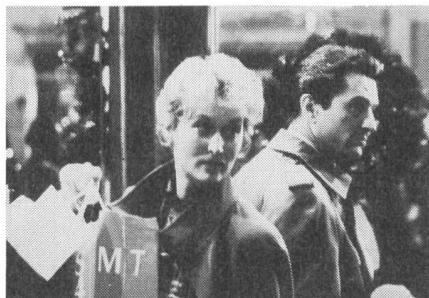
Zerwürfnisse mit dem Ehepartner ...