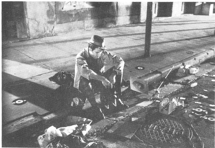
Tom Waits in DOWN BY LAW