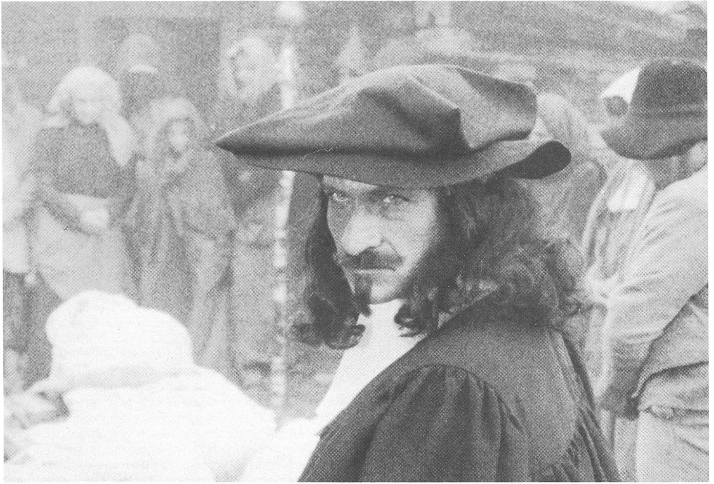
Die Vergangenheit schaut uns auch in der Zukunft an – sie gehört unauslöschbar zu uns.