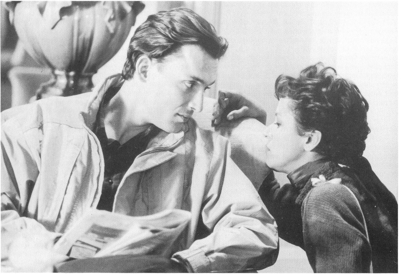
Sprecher hat zunehmend Mühe, Verständnis für seine Erlebnisse zu finden.