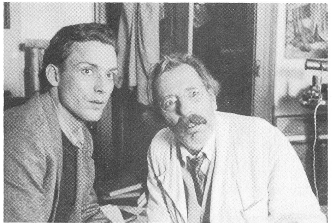
Jean Bouise , geboren 1929 in Havre Spezialist für anspruchsvolle Nebenrollen in (unvollständig):

Ansatzweise vorhanden sind wiederum jene wundersamen Landschafts-Aufnahmen, in denen Renato Berta wie schon in VIOLANTA es einnehmend schafft, das Mythische der Bergwelt und damit auch den Humus einer solchen Geschichte einzufangen, ohne plakativ zu werden. JENATSCH bleibt in seiner besseren, seiner stärkeren Hälfte ein Bündner-Film, in dem Menschen ihrer Landschaft entwachsen. Darüber hinaus geraten Schmid Stimmungen wie jene von Sprechers Fahrt auf Schloss Riedberg mit dem schweigenden Taxichauffeur, sein Gang zurück, die Fahrt auf dem Heuwagen mit dem stummen Bauernpaar: da scheint eine Bildkraft vergleichbar jener etwa von Murnaus NOSFERATU durch, und leicht kafkaesk ist dieser Gang aufs Schloss oben drein. Da wird «Geschichte zur Fiktion», da demonstriert Daniel Schmid am eindrucklichsten, wie sich Geschichten vor unseren Haustüren finden, man muss nur die Sinne für sie offen halten und ihnen frei begegnen. ■