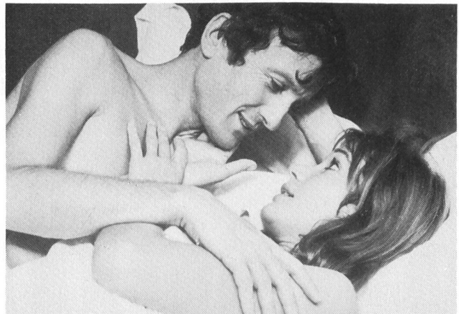
JE T'AIME, JE T'AIME (1968)