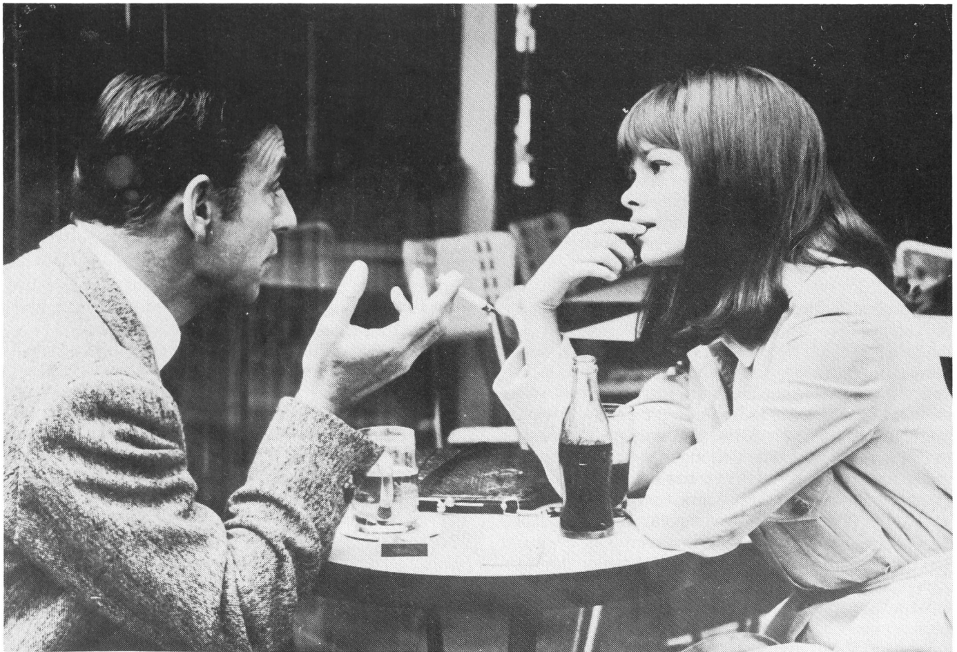
Yves Montand und Geneviève Bujold in LA GUERRE EST FINIE (1966)