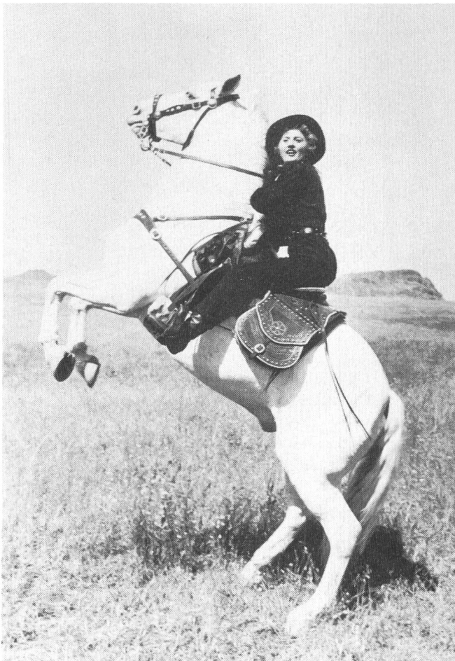
FORTY GUNS von Samuel Fuller