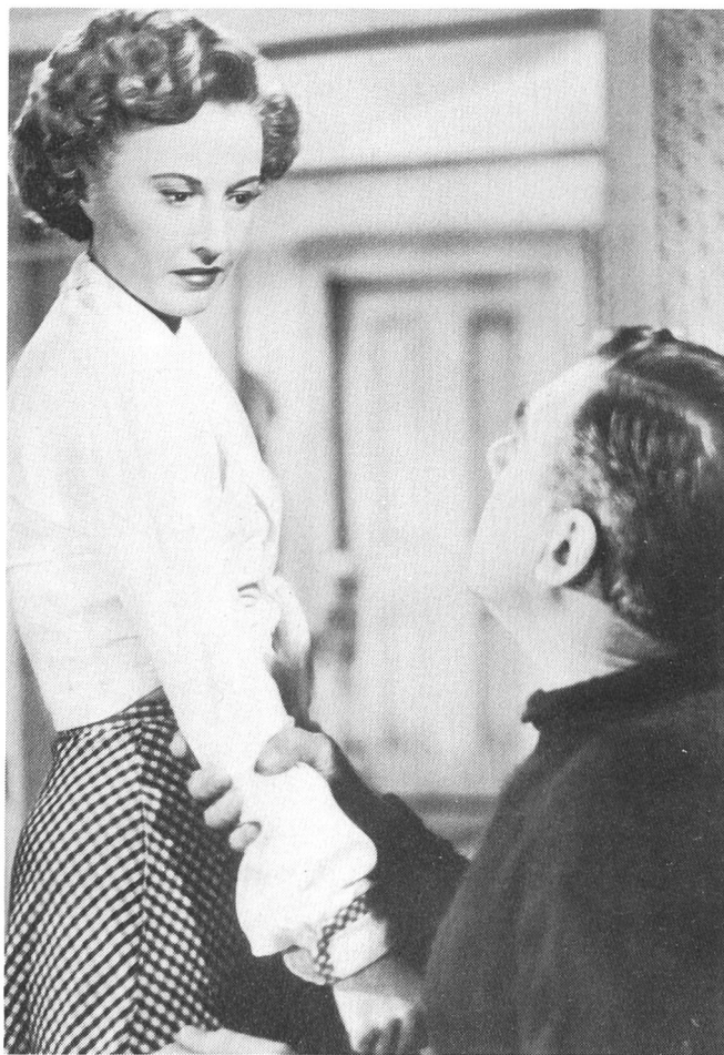
CLASH BY NIGHT von Fritz Lang

Sie ist die grosse Rancherin, the high ridin' woman with the whip , die das weite Land beherrscht, als sei es ihr Privatbesitz. Diese Herrschaft demonstriert sie, indem sie die Gewalt des Faustrechts vorführt. Indem sie im schwarzen Hosenanzug übers Land reitet, auf einem grossen weissen Pferd, mit vierzig Männern im Gefolge. Wie sie ihre Macht demonstriert, stellt sofort klar: Jeder,