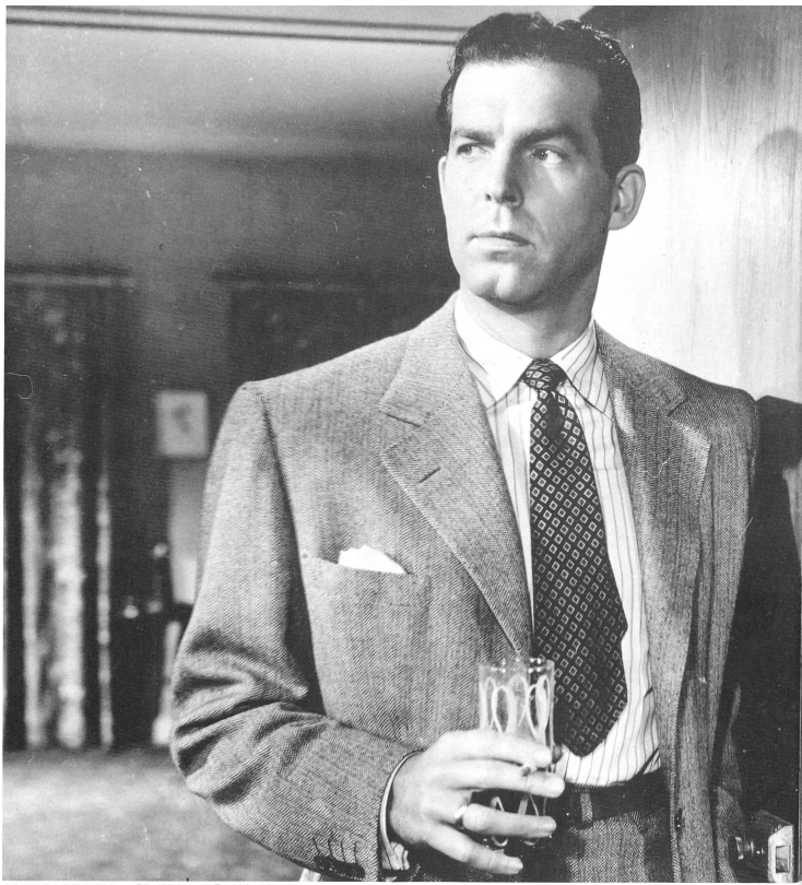
DOUBLE INDEMNITY von Billy Wilder, mit Fred MacMurray