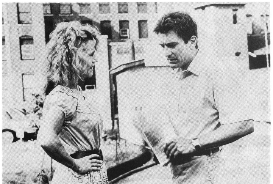
Jane Fonda als Iris mit Robert De Niro als Stanley

Im jüngsten amerikanischen Kino ist die 36-Stunden-Woche schon lange ein alter Hut. Dort wurde vor geraumer Zeit die 0-Stunden-Woche durchgesetzt. Es wird geliebt, geschossen, getaucht – gearbeitet wird kaum. Martin Ritt kämpft seit langem schon für die Arbeitszeitverlängerung im Kino. Von Arbeitskämpfen handeln unter anderem sein Meisterwerk THE MOLLY MAGUIRES und NORMA RAE . Doch im Gegensatz zu diesen Filmen interessiert ihn die Arbeitswelt diesmal nicht als solche, sondern nur als Lebensraum seiner Figuren. In der stärksten Szene in NORMA RAE zeigt Ritt die Fabrikhalle und lässt uns sehen und hören, wie beim Streik eine Maschine nach der anderen abgestellt wird und der unerträgliche Lärm bis zu völliger Stille erstirbt. Ein lautloser Protest. In STANLEY AND IRIS werden die Maschinen nie zu Hauptakteuren, die die Handlung vorantreiben. Gelegentliche Fahrten an Fließbändern entlang dienen nur dazu, Figuren in Szenen ein-