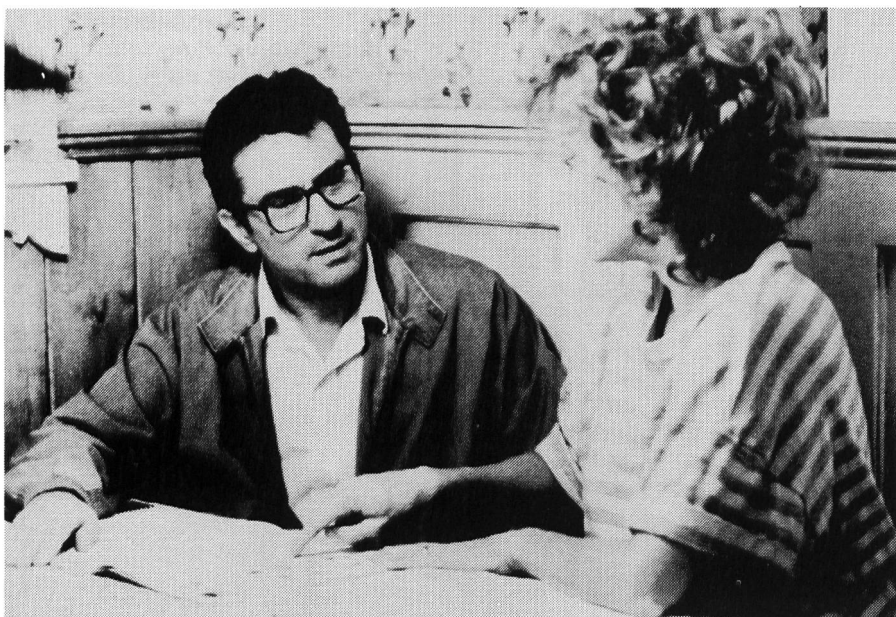
Nachsitzen als heimliches Rendezvous

Al Reilly, der Assistent des Staatsanwaltes Kevin Quinn, bekommt seinen ersten Fall zugeteilt. Er soll gegen den Polizisten Mike Brennan ermitteln, der einen Drogendealer erschossen hat. Zur Befragung hat Reilly einige Zeugen ins Präsidium geladen. Bobby Tezador, der selbst im Drogengeschäft tätig ist, erscheint mit juristischem Beistand. Lumet inszeniert diese Be-