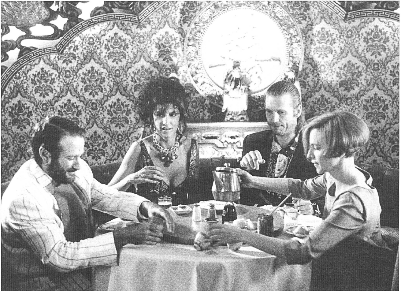
Robin Williams als Parry, Mercedes Ruehl als Anne, Jeff Bridges als Jack und Amanda Plummer als Lydia