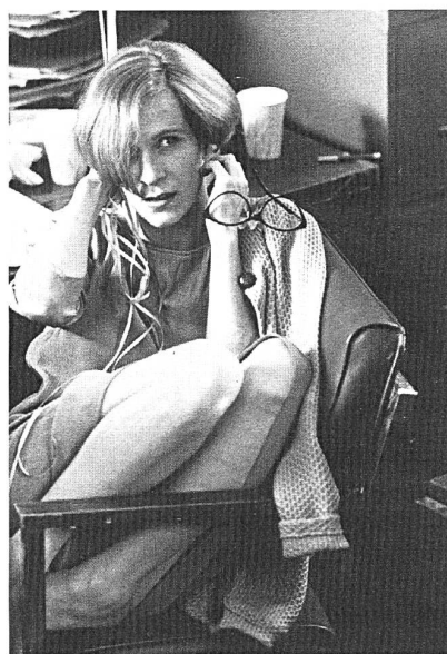
Amanda Plummer als Lydia

(Parry dagegen bleibt ohne Exposition). Nach seinem Hörfunk-Auftritt bereitet sich Jack darauf vor, demnächst auch Fernseh-Star zu sein, so dass das Gesicht hinter der Stimme endlich sichtbar wird. Aber seine mehrfach deklamierten Worte «Forgive me!» , eine einstudierte Dialogphrase aus seiner zukünftigen Fernseh-Show, sind nach oben gespro-