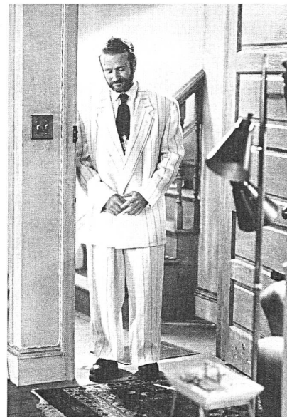
Robin Williams als Parry

(Parry dagegen bleibt ohne Exposition). Nach seinem Hörfunk-Auftritt bereitet sich Jack darauf vor, demnächst auch Fernseh-Star zu sein, so dass das Gesicht hinter der Stimme endlich sichtbar wird. Aber seine mehrfach deklamierten Worte «Forgive me!» , eine einstudierte Dialogphrase aus seiner zukünftigen Fernseh-Show, sind nach oben gespro-