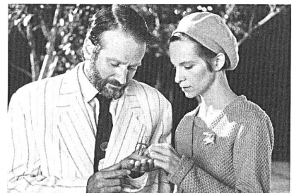
Robin Williams mit Amanda Plummer

Auf der komödiantischen Ebene erzählt der Film vor allem von der Beziehung dieses seltsamen Männerpaars Lucas und Parry zu den Frauen Anne und Lydia, die trotz ihrer materialistischen Bodenständigkeit und ihres buchhalterisch-kalkulierenden Denkens das Herz auf dem rechten Fleck zu haben scheinen. Jack springt am Ende über seinen Schatten, wenn er sich zu seinen Gefühlen zu der Videothekarin Anne bekennt, die sich in den drei Jahren seiner Existenzkrise um ihn gekümmert hat. Und der Don-Quijote-Ritter Parry, dem die Wirklichkeit anders erscheint als dem Normalsichtigen, erobert sich als seine Dulcinea eine unscheinbare, verschrobene Büroangestellte mit unkultivierten Manieren, die in seiner Phantasie zum Edelfräulein avanciert. Gilliam kann sich bei der Umsetzung