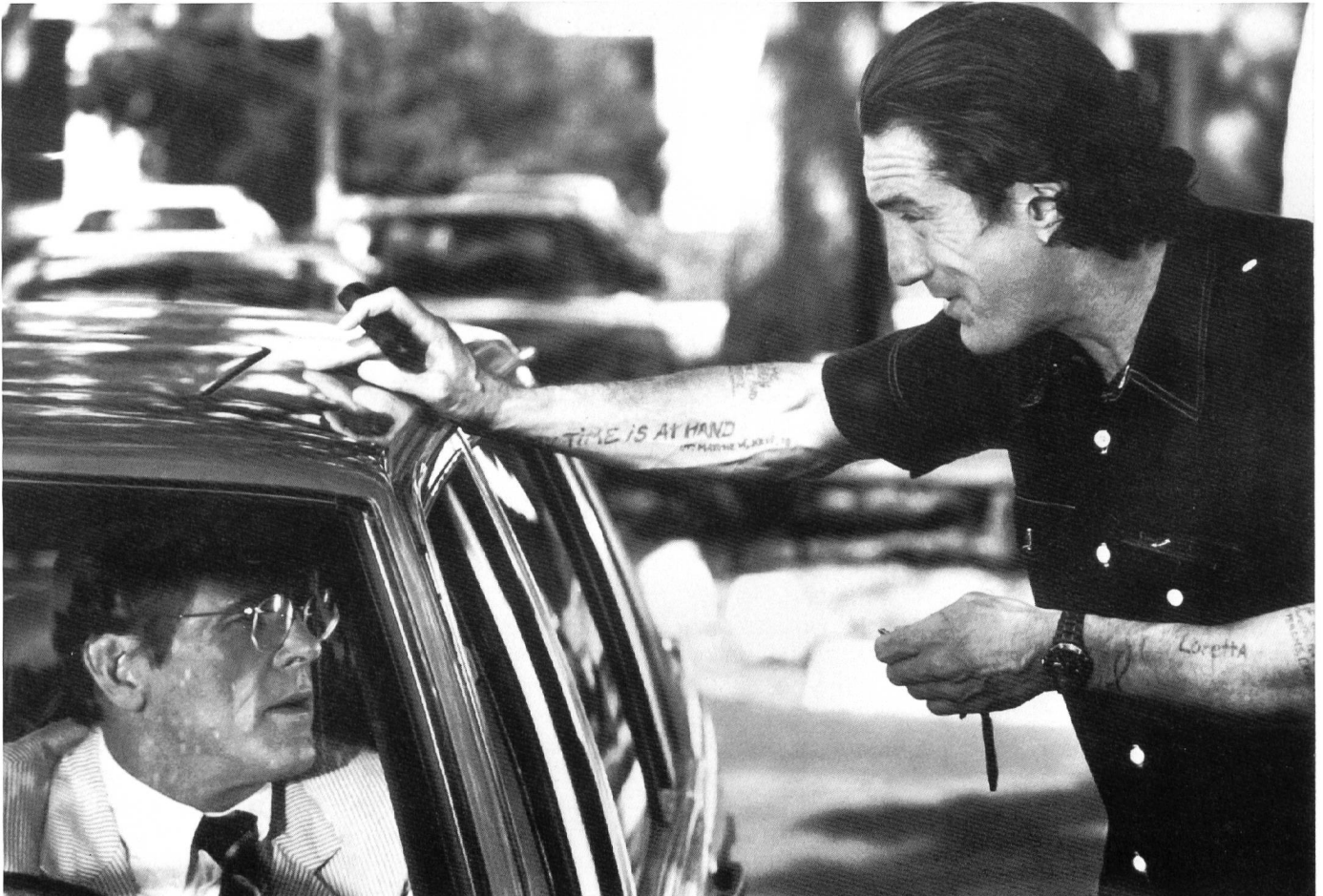
Nick Nolte als Sam Bowden und Robert De Niro als Max Cady

Zwischen Nick Nolte nun und Robert De Niro könnte man sich hingegen heute eine Vertauschung recht gut