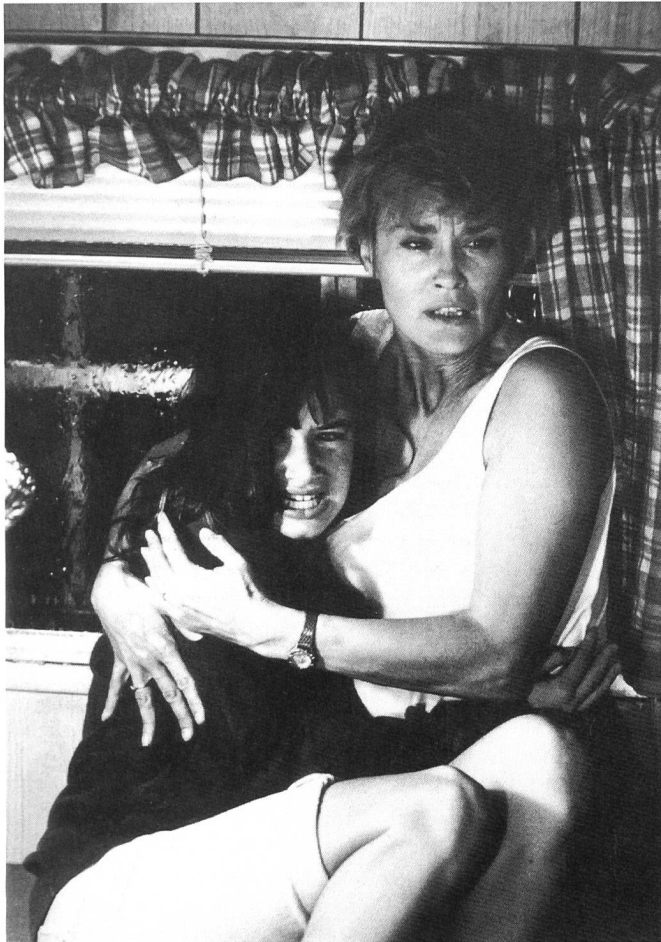
Jessica Lange als Leigh Bowden und Juliette Lewis als Danielle

vorstellen. Der genialische Lieblingsschauspieler Scorsese aus MEAN STREETS, TAXI DRIVER, RAGING BULL und andern denkwürdigen Kinostücken seines Entdeckers und Mentors mimt den Wüstling Cady nüancenreich und verspielt, absichtsvoll stilisierend und kunstvoll zwischen Südstaaten-Slang und der Sprache angelesener Halbbildung schwankend; und zwar tut er es so, dass uns andauernd vor Augen gehalten wird, wie leicht es ihm vermutlich fiel, Bowden, den scheinbar biederem Anwalt, zu verkörpern, und dass er, nebenbei gesagt, sehr wohl auch als dessen böse Karikatur zu verstehen ist. Selbst in Hollywood sind schliesslich die Stars von heute viel weniger strikt gehalten, nicht anders zu erscheinen, als die Kundschaft sie tatsächlich oder angeblich gern sieht.