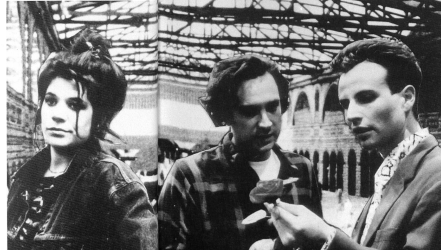
AUS ALLEM RAUS UND MITTEN DRIN (1968) Regie: Pius Morger