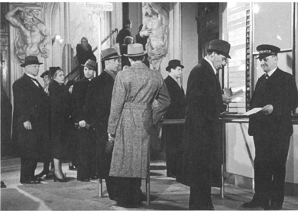
FRÄULEIN HUSER (1940) Regie: Leonard Steckel