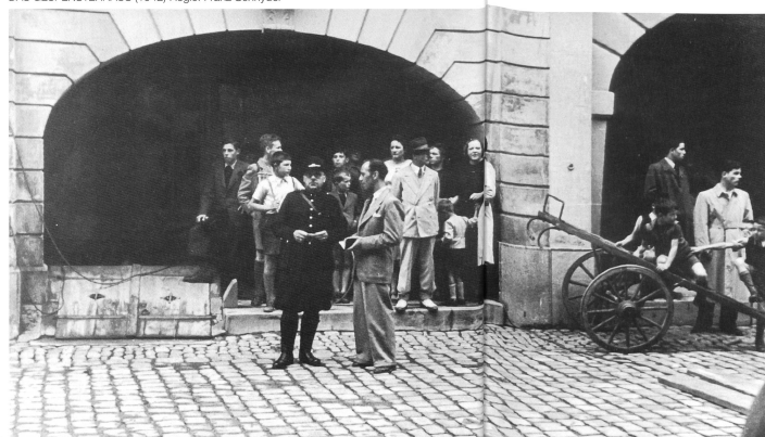
DAS GESPENSTERHAUS (1942) Regie: Franz Schnyder