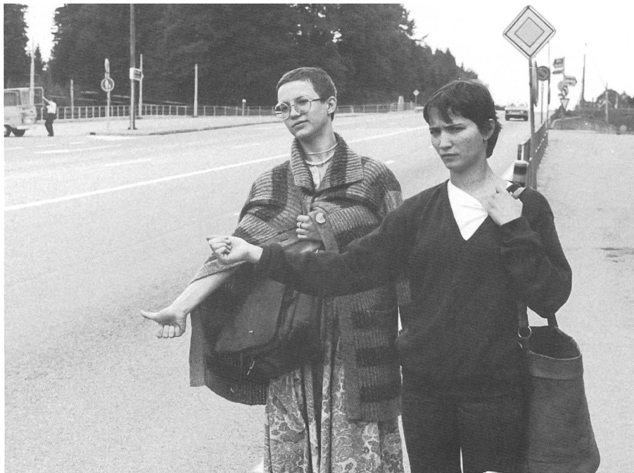
MESSIDOR (1979) Regie: Alain Tanner