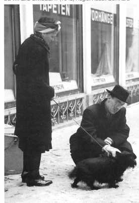
DE WINZIG SIMULIERT (1942) Regie: Rudolf Bernhard