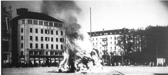
DER ACHTI SCHWYZER (1940) Regie: Oskar Wälterlin